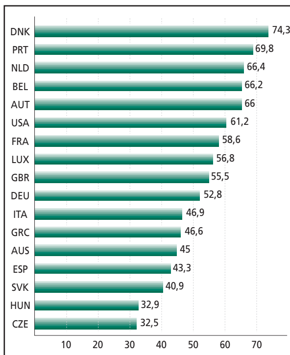
TASAS DE EMPLEO DE LAS MADRES CON HIJOS MENORES DE 6 AÑOS. OCDE, 2001.

Este gráfico deja claro por tanto, que el hecho de tener descendientes menores de 6 años influye más negativamente en la tasa de empleo de las madres en el Estado español que en la mayoría de los estados miembros de la OCDE.