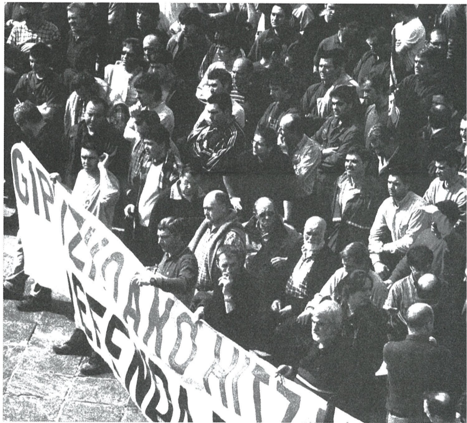
Irudian, joan den astelehenez Tolosan metal eta papergintzako langileek egin zuten manifestazioaren une bat.