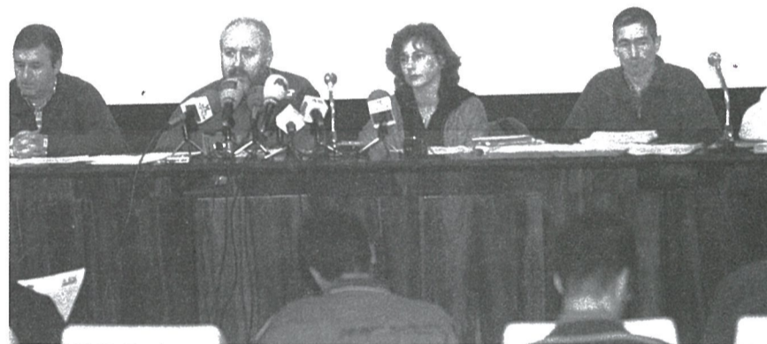
En la foto, la reunión del jueves de administración local y foral.

denunció Elorrieta. "Lo que ocurre es grave, porque la negociación colectiva es más que la revisión salarial, lo que ocurre es grave porque ha habido un interés manifiesto de cerrar sin negociación el acuerdo, lo que ocurre es grave porque el mismo ha concluido sólo con el respaldo de la minoría sindical, lo