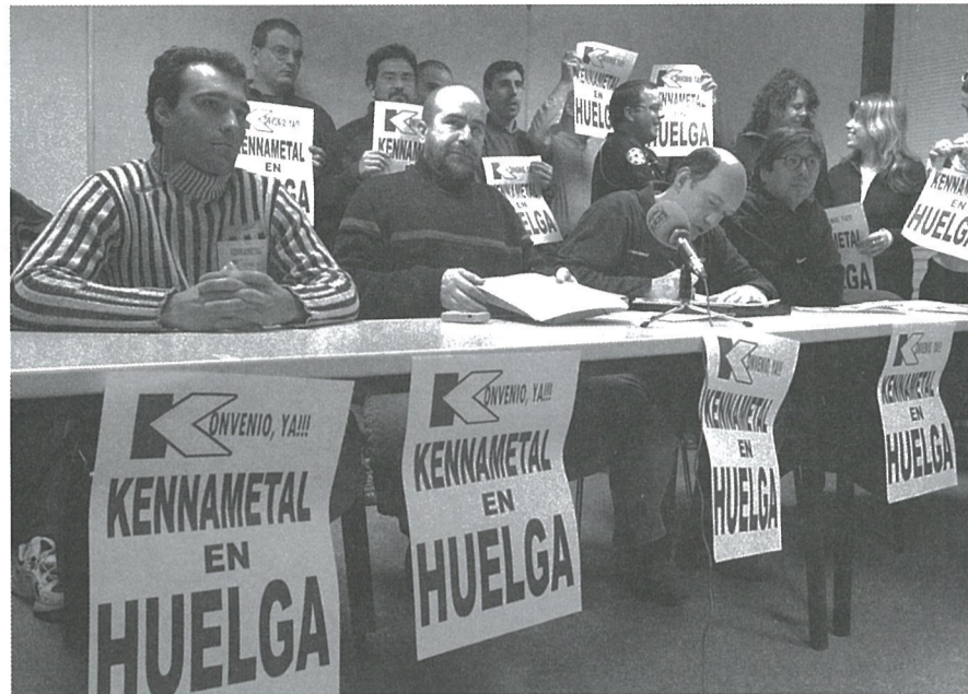
Rueda de prensa ofrecida durante la huelga de Kennametal.

Se han conseguido buenos acuerdos en la casi totalidad de las empresas en que se ha negociado el convenio. En todas ellas –y estamos hablando de una veintena de empresas de pymes o de comité–, el incremento salarial ha superado con holgura el IPC pasado y se han establecido cláusulas para mejorar la calidad del empleo y convertir a fijos muchos de los empleos precarios que tenían. También hemos logrado buenos acuerdos en jornada. En muchos casos, los acuerdos han estado precedidos de duras huelgas, como en Aratubo o Kennametal.