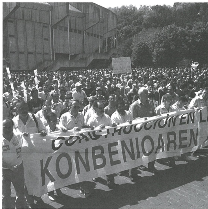
Intentar enfrentar a trabajadores y autónomos con el objetivo de convertir una huelga pacífica y ejemplar en un conflicto de orden público.

Algunos trabajadores autónomos, por su parte, han acordado reanudar la actividad el lunes aunque la huelga siga convocada. Gorraiz ha pedido a los autónomos solidaridad, ya que el convenio les afecta también, aunque sea indirectamente, al tiempo que ha acusado a la patronal Adegí de