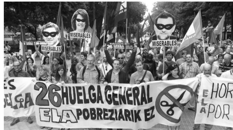
Iruñean irailaren 12an egin zen delegatuen asanbladaren osteko manifestazioa. Parte hartu zuten ordezkariak ez zuten zalantzarik izan krisiaren errudunak seinatzeko orduan.

Horregatik funtsezkoa da irailaren 26ko greba orokorra arrakastatsua izatea. Baina, eta hau ere hamaika aldiz aipatu dugun bezala, ez gara egun bakarreko borroka mintzo. Funtsezkoa da ere irailaren 26ko deialdiari begira antolatu diren ekimenetan parte-hartzea. Eta, horien artean, Bilbon, Gasteizen eta Donostian egingo diren manifestazioek garrantzia berezia dute. Kaleak beteta ikusten badituzte, “kontxo, hauekin zail izango dugu” pentsatuko du kapitalak. Kaleak hutsik ikusten badituzte, berriz, “kontxo, hau da gure aukera!” pentsatuko du.