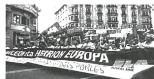
In Barcelona, over 1,500 ELA militants expressed the social discontent with the European construction process

May 2002 No. 11 ELA newsletter Solidarity of Basque workers