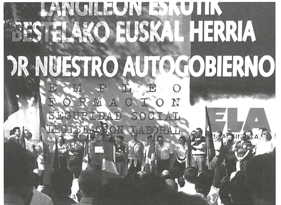
Una imagen del acto de ELA en Gernika, que tuvo lugar el 18 de octubre de 1997.

El "Documento base" del Comité Nacional parte del análisis del estado del autogobierno, para ratificar el agotamiento, definitivo e irreversible, del