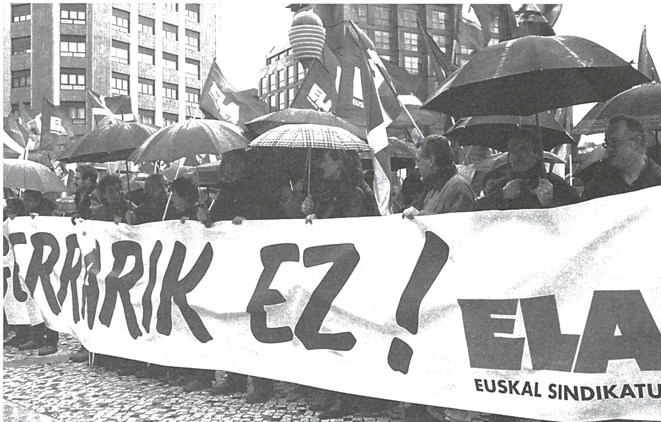
El Consejo Nacional en pleno, junto con delegados y delegadas de ELA, protestaron por la anunciada guerra contra Irak.