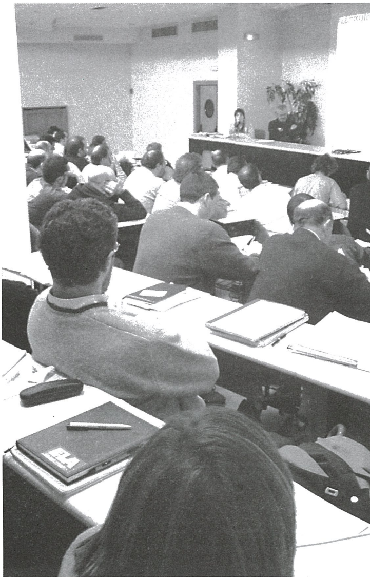
Un momento de la reunión del Consejo Nacional de ELA.

El Consejo Nacional valoró la nueva reforma del impuesto sobre la renta de las personas físicas (IRPF) que han aprobado las diputaciones forales de Bizkaia y Alava (está pendiente la de Gipuzkoa). El Consejo denunció que, frente a los mensajes de las administraciones –"la reducción del IRPF beneficia a todos los contribuyentes"–, las personas con ingresos más modestos y medios, la mayoría de la clase trabajadora, apenas notan la reforma, mientras que sí supone un ahorro apreciable para las rentas más altas.