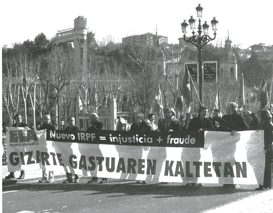
Un momento de la manifestación de Bilbao.