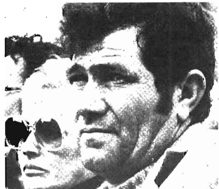
ELA descubre la necesidad de insistir en la militancia de sindicalistas, más en estos momentos