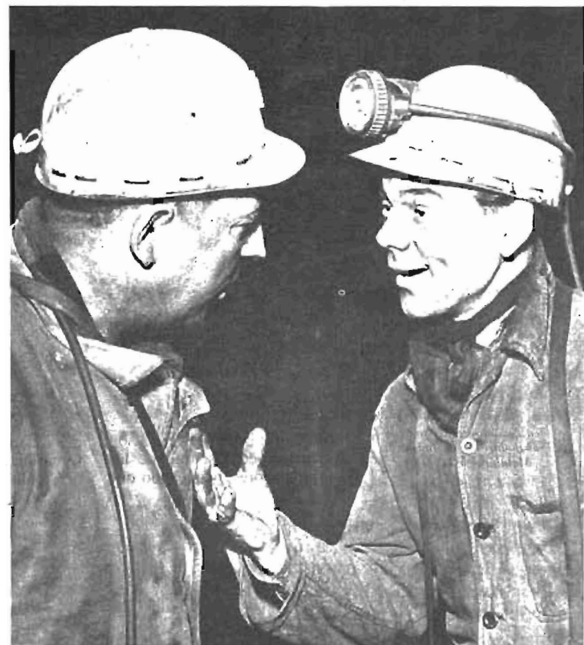
En circunstancias de crisis económica como las actuales es más asimilable una reducción de jornada que un aumento de salarios y tenemos que saber combinar los elementos en la negociación

Y ya que hablamos de tarta, hay una primera idea: no queremos simplemente una tarta mayor, a los sindi-