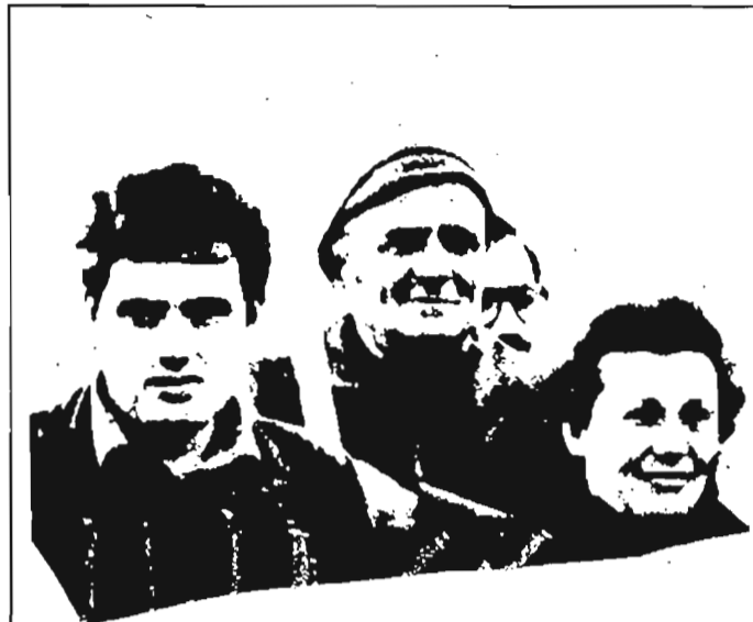
Euskadiko dinamika sindikalak Estatutua hankaz gora botako du

Euzko Langileen Alkartasuna / Solidaridad de Trabajadores Vascos