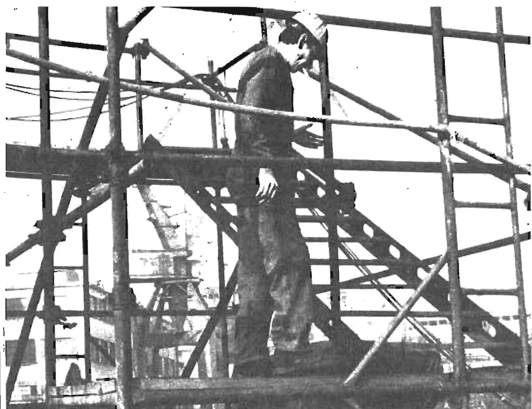
El Estatuto de los Trabajadores carece del mínimo realismo, está construido en el aire con una estructura endeble que no va a soportar los embates de la dinámica social