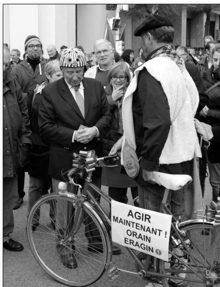
Suivez et revivez l'épopée de la "Bizi Kleta" sur www.bizimugi.eu !

Alda!ren bloga : www.mrafundazioa-alda.org