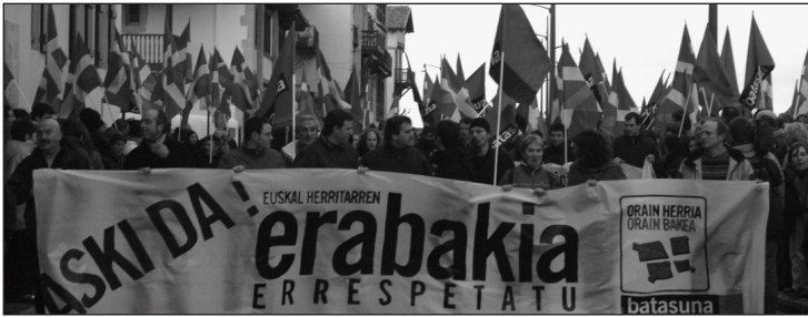
Le cortège se dirige vers St Jean de Luz