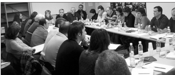
Comité national du syndicat ELA à Bayonne