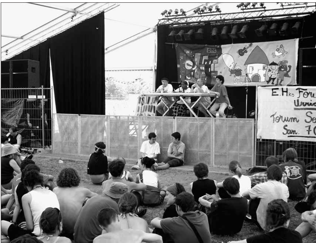
José Bové au Festival Euskal Herria Zuzenean

Enb.: Cinq membres du mouvement «Demo» passeront en procès ce vendredi 30 mars pour avoir renversé une voiture, devant la sous-préfecture, pour simuler un accident de voiture, comme ceux