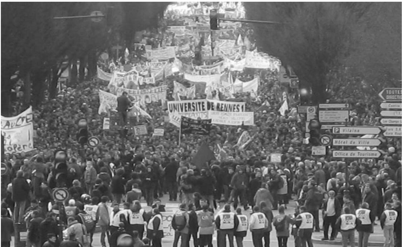
Rennes-eko CPE-ren kontrako mugimenduari buruzko argazki gehiago eta bideo proiektzioa, apirilaren 6an ostiralarekin, arratseko 7etatik landa Baiona Ttipian (Chaho kaia, 22a), Manu Robles-Arangiz Fundazioak antolatutik