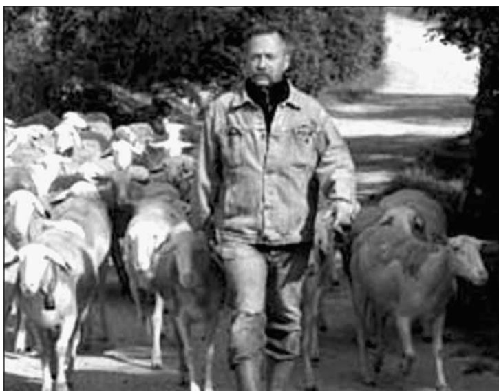
Sur le plateau du Larzac

seulement participe à la résistance du peuple basque mais aussi participe à la promotion d'un autre modèle d'agriculture qui n'est pas simplement important pour le Pays Basque mais est le modèle à développer sur l'ensemble du territoire français et européen. C'est en même temps toute la question de la souveraineté alimentaire et de la relocalisation de l'économie qui est liée à ce projet.