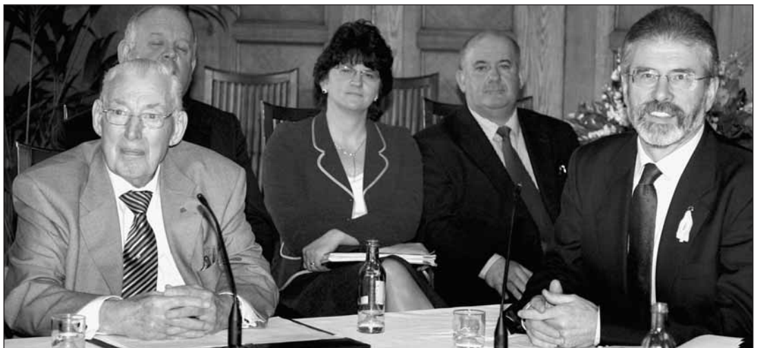
Lundi 26 mars, Ian Paisley et Gerry Adams à la même table

I L aura fallu neuf années pour que l'accord historique du Vendredi Saint 1998, qui mit fin à la lutte armée de l'IRA, se traduise en accord de gouvernement entre Unionistes et Républicains irlandais. Ce lundi 26 mars, les leaders des deux camps, Ian Paisley et Gerry Adams, se sont assis à la même table pour négocier la composition d'un gouvernement autonome de l'Ulster qui s'installera le 8 mai. Le rapport de force issue des dernières élections législatives, soit 36 députés pour le DUP et 28 pour le Sinn Fein, sera respecté dans ce gouvernement de dix membres présidé par Ian Paisley avec pour vice-Premier ministre Martin Mac Guinness, ancien chef de l'IRA.