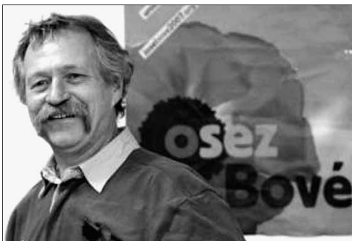
Candidat à la présidentielle

«Rendez-vous est donné pour toutes et tous les partisans de José Bové ce samedi 7 avril à 10H30 devant le bar Sankara, 22 quai Chaho dans le Petit Bayonne, avec son vélo. Une ballade à bicyclette en partira pour traverser les rues de Bayonne. Ceux et celles qui n'ont pas de vélo sont également invité(e)s à ce rendez-vous : ils pourront participer à une distribution de tracts en musique qui aura lieu au même moment au marché des Halles et à la Foire au Jambon. Pour plus de renseignements, contactez alternatosezbove@orange.fr ».