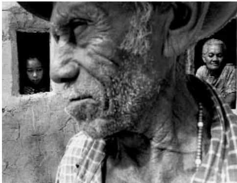
Exposition durant les "Rencontres" d'un travail photographique mené par le photographe brésilien Tiago Santana autour du Documentaire "Rêve de Sao Paulo"

Chaque jour à Vienne, la quantité de pain inutilisée, et vouée à la destruction,