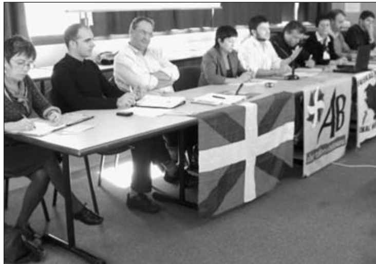
Une partie du bureau d'AB

A PRÈS une année riche, l'Assemblée générale d'AB s'est déroulée le samedi 20 octobre dernier. Texte de philosophie générale de l'abertzalismo, guide pour préparer les élections, livre blanc programmatique en cours d'élaboration, feuille de route de l'élu, tous les outils sont prévus pour bien aborder les échéances électorales de l'an prochain. Côté stratégie la ligne est définie: aux municipales, AB préconise des listes abertzale au premier tour, utiles au deuxième, mais laisse la décision finale aux groupes municipaux locaux; quant aux cantonales, mandat est donné à l'exécutif pour lancer la campagne au sein de la coalition Euskal Herria Bai. Reste maintenant à mobiliser les troupes.