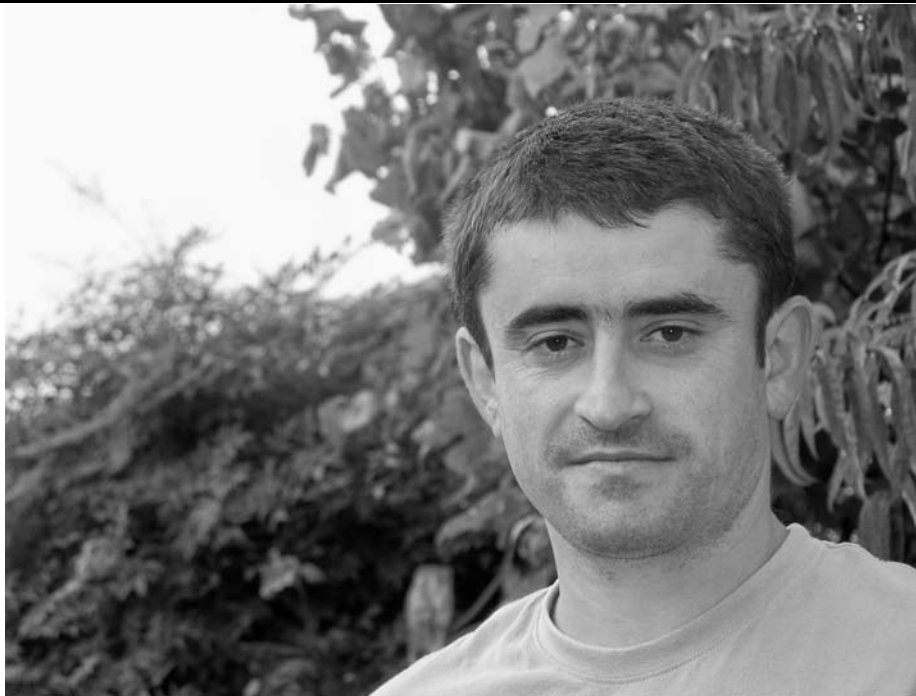
"Hautagai izaiteko hautu pertsonala hartzeko momentoan on da hurbileko pertsonekin erabaki horren eztabaidatzea!"

Avec l'expérience, j'ai compris que lorsqu'on vient demander à un conseil municipal