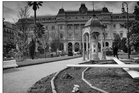
Députation de Gipuzkoa

Elle s'élève à 6,24% des dépenses engagées par l'Etat espagnol dans le cadre de ses compétences exclusives (pour l'essentiel la défense, la représentation diplomatique, la maison royale et les douanes). Cette contribution