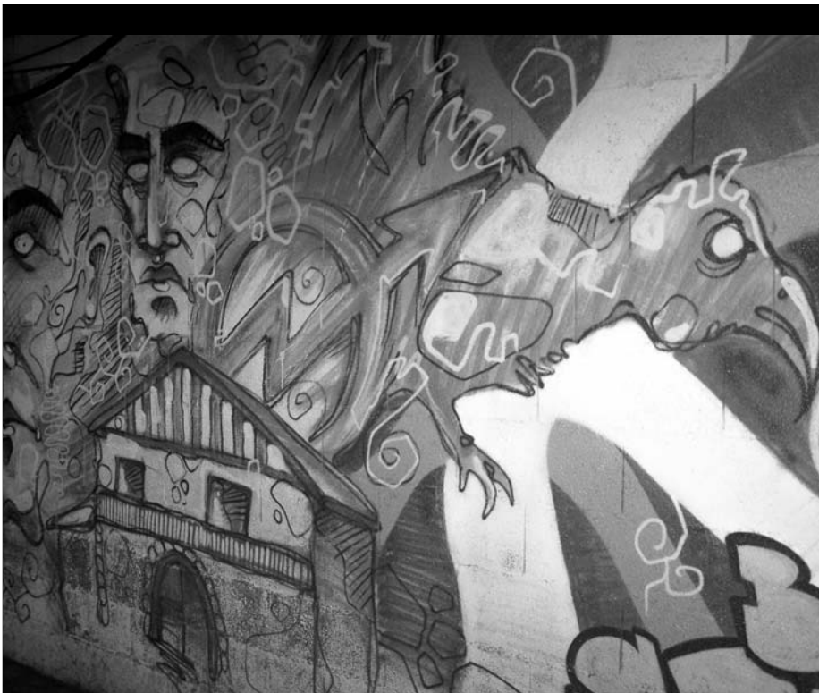
Immobilier, Prisonniers, Mondialisation (Océan, OGM, etc.) sont différents thèmes traités lors des conférences à Bota .

Azken finean, gaur egun Bota Gaztetxeak animatzen duen lokala, 2006an atxeamana izan zen Donaixtin berean.