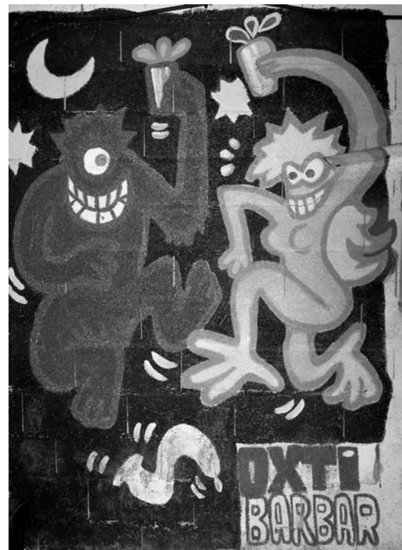
Depuis que Bota ("Patia...") a refait vivre le carnaval d'Oztibarre, c'est devenu un rendez-vous pour les jeunes d'Oztibarre... et d'ailleurs !