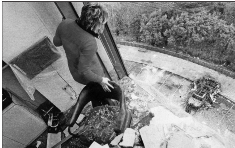
Une journaliste d'EITB regarde de son bureau dévasté la voiture pulvérisée

et la gauche abertzale, non seulement n'ont trouvé rien de mieux que de s'attaquer à un des symboles du pouvoir basque —en son temps conquis de haute lutte contre l'Espagne— mais également à la liberté de la presse. La fermeture par le gouvernement espagnol de quotidiens tels que Egin ou Egunkaria relevait bien entendu d'une dérive fasciste du pouvoir. En s'attaquant à des journalistes ou à des médias (2), la gauche abertzale reproduit en miroir des actes détestables... parés de vertus politiques et péda-