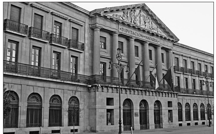
Députation forale de Navarre

En vertu de l'accord signé le 9 janvier 1981 entre le Pays Basque et l'Etat