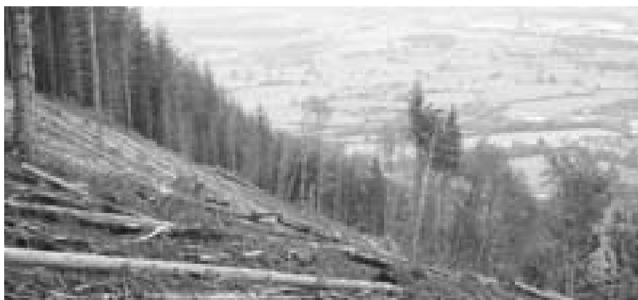
Exemple de coupe à blanc