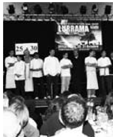
... des chefs