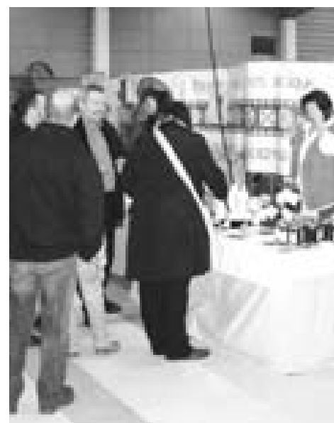
... un critique gastronomique