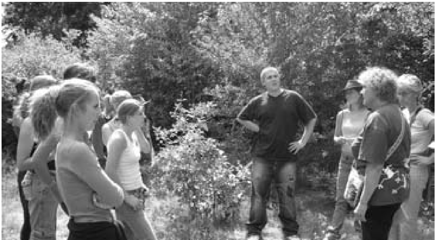
Visite en forêt de Montmain, première forêt achetée par le Groupement Forestier

De nos jours, plutôt que de s'attaquer aux causes, sont mis en place des outils comme la certification PEFC, des chartes qui ne sont pas opposables, des grenelles qui ne solutionnent rien