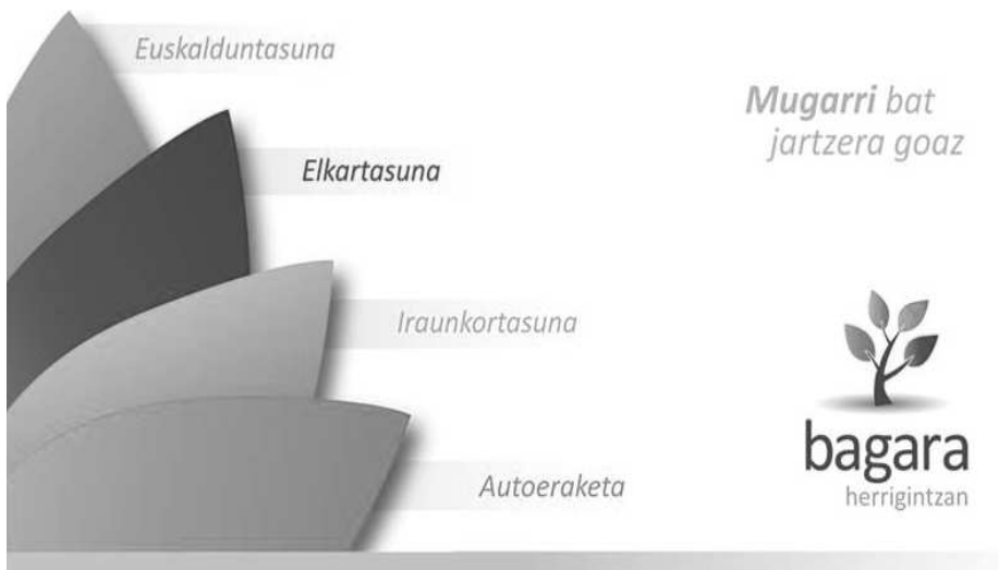
Bagara egitasmoak elkartasuna, euskalduntasuna eta iraunkortasuna ditu oinarri eta ipar nagusi, eta autoeraketa hartzen du norabidetzat.

Ibilbide hegemoniko berritzailea abian jartzeko "adierazle huts" baten inguruko artikulazioaren komenigarritasunaz jabetzea da kontua. Areago oraindik, ezinbestekotasunaz.