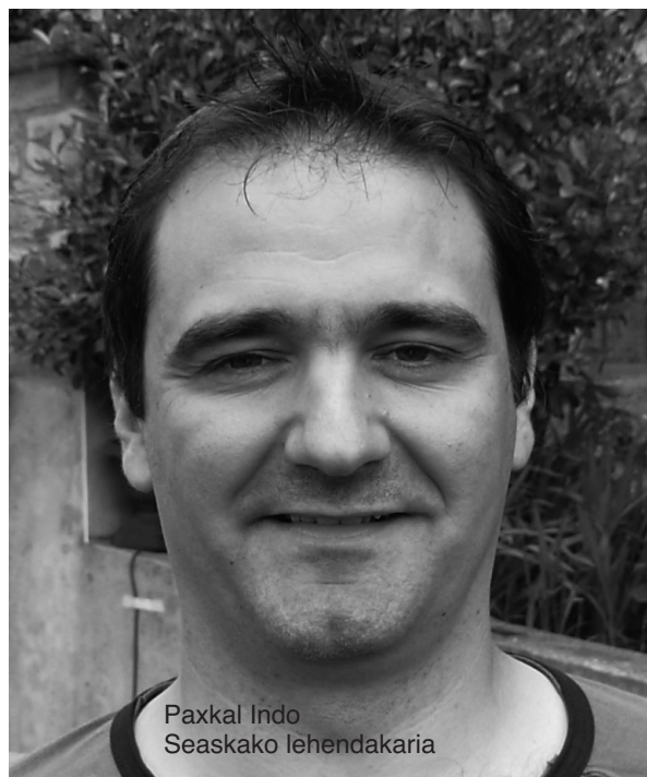
Paxkal Indo Seaskako lehendakaria

Ez da dudarik Iparraldeko ikastolen karta has-tapenetik ongi orekatua izan dela, baina gaur egungo desafioa bikoitza da: Seaskaren murgiltze eredia proposamen bakarra denez, nola baikorki erantzun euskararen aldeko politika bati ez bada ikastola bat etxe guzietatik hurbil. Beraz hurbiltasunaren desafioa behar dugu irabazi. Eta Euskararen geroa segurtatuko duen arlo tekniko eta profesionala ere garatu beharko dugu lizeo berriaren bidez.