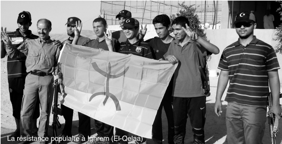
La résistance populaire à Ighrem (El-Qalaa)

puis la plaine, tombent sur les localités de l'Adrar Nefussa. Le jour de l'arrivée de la délégation du CMA le 1 er août, la localité de Jadu a déploré 8 tués par les tirs des soldats de Kadhafi. Des milliers de douilles et de restes des bombes de différents calibres jonchent les rues de Yefren particulièrement ciblée. Avant leur retrait de l'Adrar Nefussa, les soldats de Kadhafi ont tenu à détruire et à brûler systématiquement tout ce qui pouvait être utile aux habitants (magasins d'alimentation, de vêtements, véhicules, etc). Si à ce jour le nombre de victimes n'est pas connu avec précision, les dégâts matériels sont considérables. Il en est ainsi dans les localités de Nalut, Kabaw, Rehibat, Rojban, Jadu, Zenten, Yefren, Ighrem (El-Qalaa), Kekla. Les hommes de Kadhafi ont également arrêté des milliers de