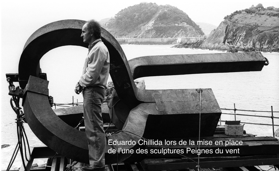
Eduardo Chillida lors de la mise en place de l'une des sculptures Peignes du vent

vir une monographie consacrée à cet artiste pour constater que beaucoup de ses sculptures et gravures portent un nom en euskara.