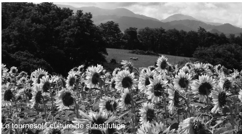
Le tournesol / culture de substitution

Artoa ez da berez landare « gaixto » bat, bere lekua badu gure alorretan. Problema da nola landua den eta monokultura sistema intentsibotik nola ateratzen den.