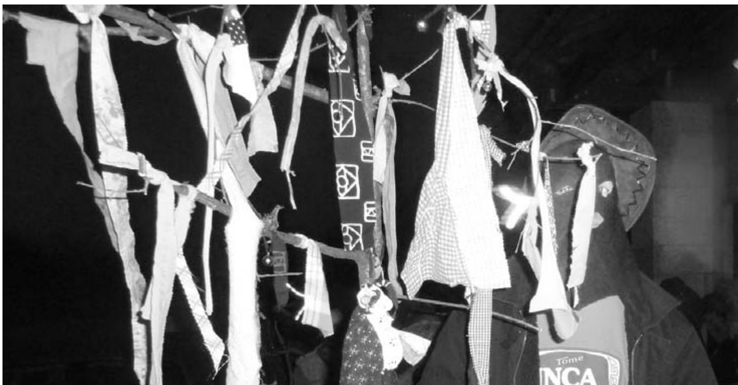
...Euskal Herrian mundu osoan bezala.

Euskal Herrian Euskaraz, Udaleku eta Kontseiluaren inguruan antolatu izan da ere zenbait egunez Euskara BALonan. Iduri luke lan iraunkor bati begira zailtasunak badirela. Bitxi bada bitxi (edo ez?), barneko lan taldeko zenbait eskerrak, badaiteke hiri erdiko mediateka dela azken hilabeteetan maiztasun handienarekin hitzorduak proposatzen dituen Euskaraz.