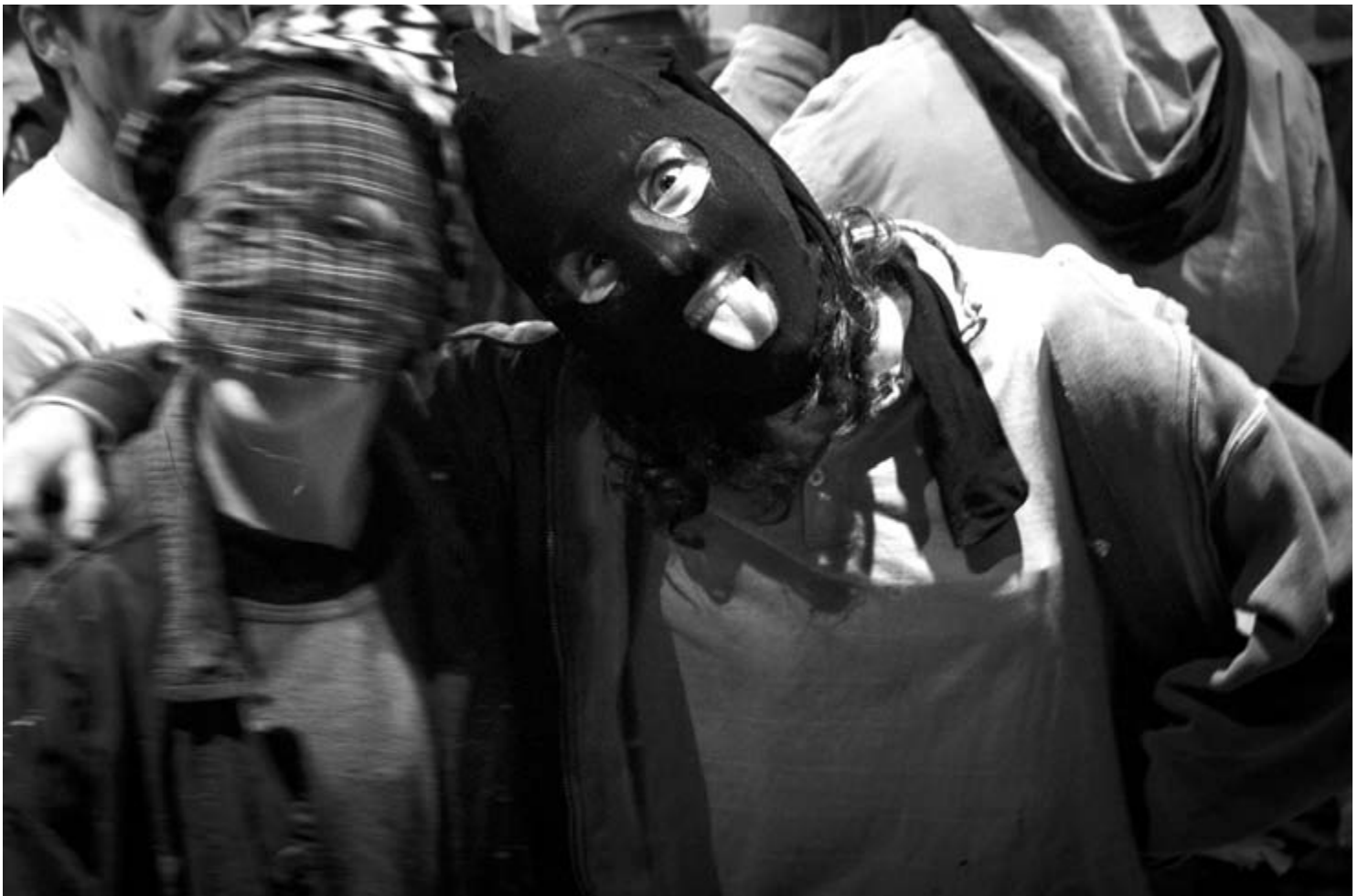
Mozorrotzea, ihauterietako ohidura...

Otsailaren 27an, Baionako zirtzilek plaza okupatuko dute denbora laburrez bada ere, dantzaz eta euskaraz, garaiko zenbait gairen jorratzeko doia.