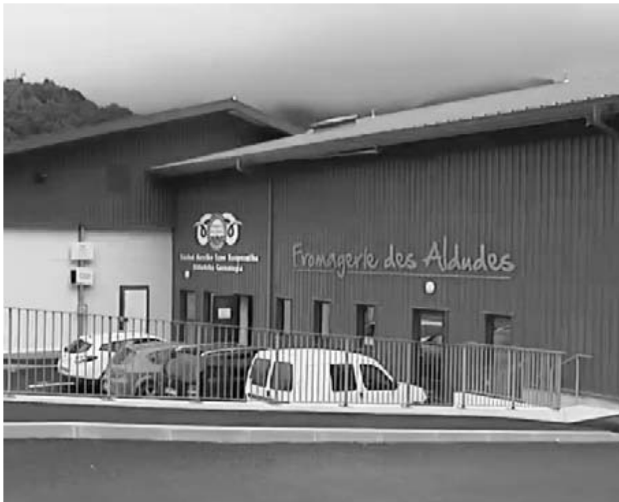
Entreprise de transformation de la matière première dans la vallée des Aldudes.

Plus d'une trentaine d'entreprises agroalimentaires adhère et constitue le cluster Uztartu. Elles développent plus de 70 millions d'euros et emploient environ 1.000 personnes. Ces entreprises emploient de 2 à 50 personnes. Le capital de ces sociétés est familial ou territorial (Pays Basque).