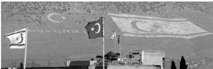
Chypre, l'île aux deux drapeaux.

Un autre aspect à prendre en compte est l'attitude des "parrains" des deux parties de l'île, la Grèce et la Turquie. Si Athènes soutient la réunification, elle demande le retrait total des troupes turques stationnées en RTCN (environ 35.000 hommes), ce qui semble peu probable. La Turquie multiplie quant à elle les signes positifs. Le premier ministre turc a par exemple publié sur son compte Facebook une photo de lui en compagnie du président chypriote grec, ce qui était