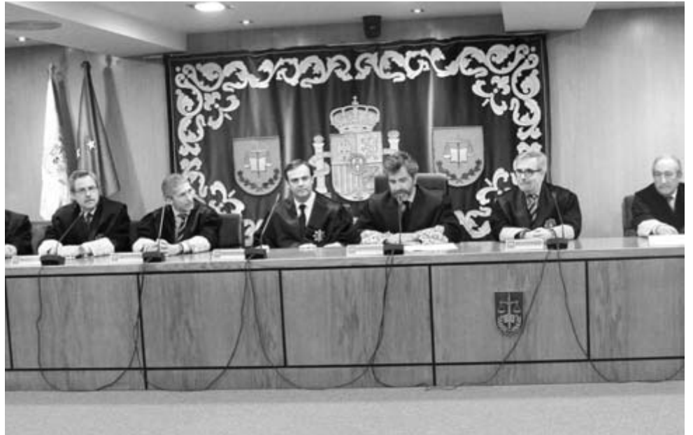
L'audience nationale espagnole, tribunal d'exception.

Différents points de cet "accord" se situent dans la logique de l'aveu, de la confession et de la contrition, dont la dimension ou les fondements religieux apparaissent clairement. Imposés par le pouvoir dominant, ils font écho aux analyses d'un Michel Foucault dans ses "Histoires des systèmes de pensée". Le philosophe français s'est longuement penché sur l'exercice de l'autorité, les processus d'obéissance et d'assujettissement politiques qui plongent leurs fondements dans le religieux et le sacré, depuis les pères de l'Eglise et le De paenitentia de Tertullien ou encore les manuels des Inquisiteurs du XVIIe siècle. Cette pratique de la conduite des hommes qui traverse nos sociétés occidentales est pleinement à l'oeuvre aujourd'hui en Pays Basque, sous la férule espagnole. Ce douloureux passage obligé sera suivi par d'autres. Mais aller à Canossa est aussi pén-