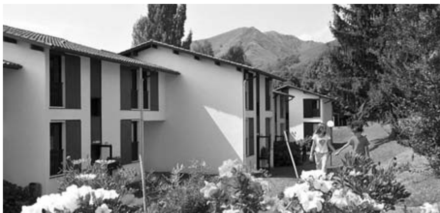
Le VVF de Baigorri accueille des migrants en provenance de Calais.

Parmi les victimes de la nouvelle loi, figurent les travailleurs sans papier participant activement à l'économie du pays, dans des secteurs qui, sinon, seraient en panne, les personnes ayant des attaches personnelles et familiales soumises à l'arbitraire des préfetures, les victimes de violences telles que la traite d'êtres humains et qui ont porté plainte ou encore les retraités