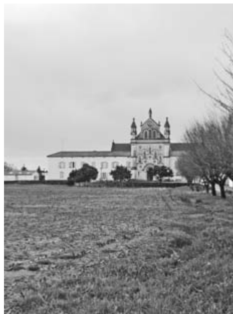
Domaine du Refuge à Anglet.

Urduri bagira ikusiz aintzineko urteetan laborantza nola desagertu den kostaldean, espero dugu, hala ere, erabaki onak eta konkretuak hartuak izanen direla hemendik goiti. Ehlg-en urte betetze egunean hor ziren laborari eta Ehlg-en lagunak konbentzituak ziren. Galdea hauxe da: leku bat utziko diogu laborantzari kostaldean? Ikusiko ze erantzun emanen dioten kostaldean. ■