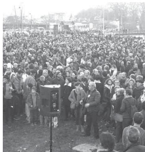
4.000 personnes en soutien aux artisans de paix le 17 décembre.

Le président français, qui s'est déclaré impressionné par la démarche de réconciliation entreprise en Colombie, pourrait lui aussi apporter une contribution directe à l'Histoire de la résolution des conflits. En autorisant un désarmement ordonné et sécurisé de l'arsenal d'ETA, il rendrait possible d'autres pas décisifs dans un scénario global de pacification et de réconciliation en Pays Basque. Ne briguant pas un nouveau mandat, qu'a-t-il à craindre du courroux du gouvernement PP qui ne jure que par la poursuite d'une stratégie de la tension et de la vengeance, elle-même porteuse de futures envies de revanche ? En refusant d'alimenter cette stratégie de la tension, c'est également aux espagnols eux-même qu'il rendrait service.