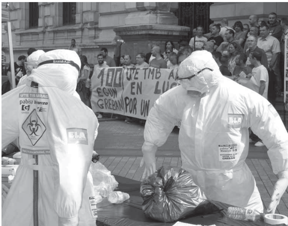
100 ème jour de grève dans l'usine de Traitement Mécano Biologique des Déchets (TMB) de la Diputacion Forale de Bizkaia. Victoire après six mois.

Le syndicat ELA, confédération ouvrière plus que centenaire et syndicat majoritaire en Pays Basque Sud célébrera ce vendredi 10 février par un rassemblement à Bilbao ses nombreuses victoires syndicales liées aux grèves menées en 2016. A cette occasion seront mises en avant l'organisation collective et la solidarité concrète (via la caisse de "résistance" ou de "grève"), ingrédients indispensables d'une mobilisation syndicale gagnante.