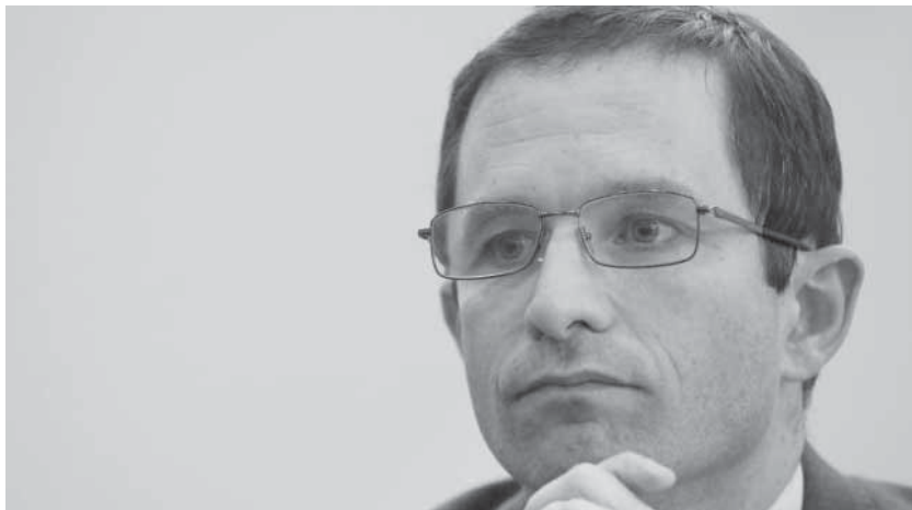
Benoît Hamon défend le principe du revenu universel.

sociales en modifiant la répartition des revenus. Il serait un instrument de lutte contre la grande pauvreté (un filet de sécurité pour les plus modestes) et renforcerait notamment l'autonomie des femmes et des jeunes. Face au chômage de masse, les travailleur-ses seraient moins soumis-es aux pressions pour accepter n'importe quel emploi. Dans cette conception progressiste, le revenu universel est distribué à tout-e-s, sans conditions, cumulable avec un emploi, sans toucher à la protection sociale