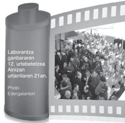
Laborantza ganbararen 12. urtebetetzea Ainizan urtarrilaren 21an.

Proposamenak badu itxura. Itxura ona gainera. Pedagogia eta konbentzitze lana abiatzeaz dute hunen bultzatzaileak. Hea ba bakotzak izanen duen jateko eta edateko. Ogia, gasna eta ahantzi gabe baso arnoa. Bazterrerat utziz agian, hea basoa erdi bete ala erdi hutsa den. ■