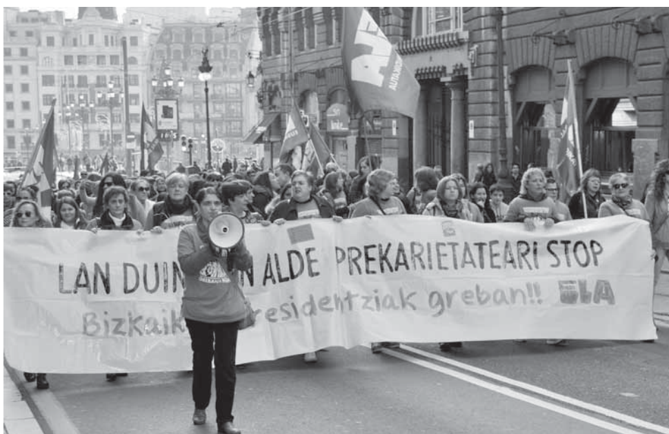
Mobilisations contre la précarité toujours en cours dans les maisons de retraite de la Diputacion de Foralede Bizkaia.

mobilisation syndicale n'obtient pas gain de cause sur toute la ligne, elle peut tirer une autre leçon. D'une part, qu'une victoire totale, sauf exception, n'existe pas, et d'autre part, que l'énergie et l'espoir mobilisés dans une lutte sont des références pour la prochaine occasion. En effet, les victoires ne viennent