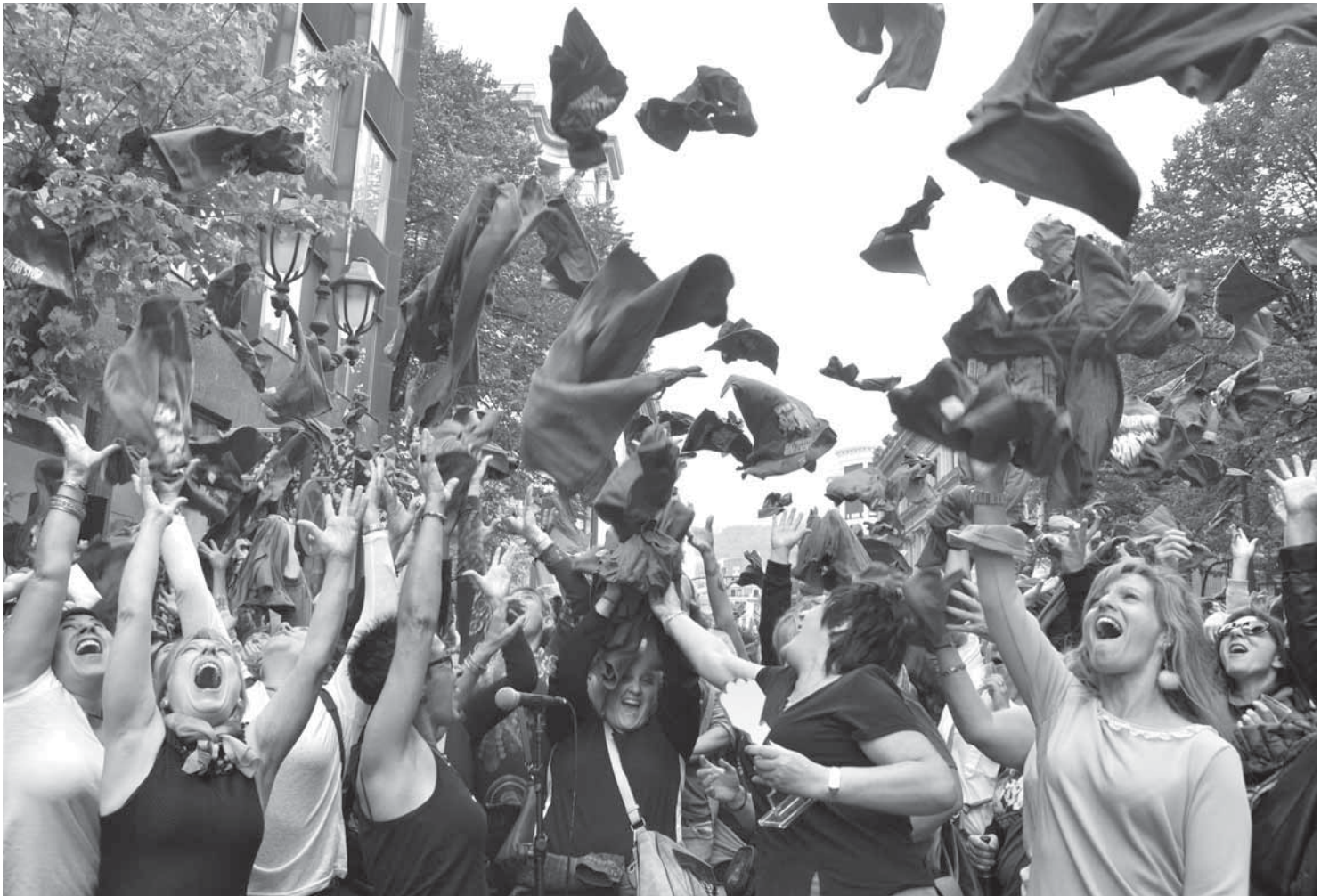
Le 27 octobre, les salariées des résidences de Bizkaia ont obtenues leurs revendications après deux ans de lutte et 370 jours de grève.

Après deux ans de lutte, dont plus d'un an de grèves, les soignantes des maisons de retraite de Biscaye viennent de remporter, avec le syndicat ELA, une "victoire historique" qui questionne la discrimination des femmes dans le monde du travail et leur avenir dans la lutte syndicale