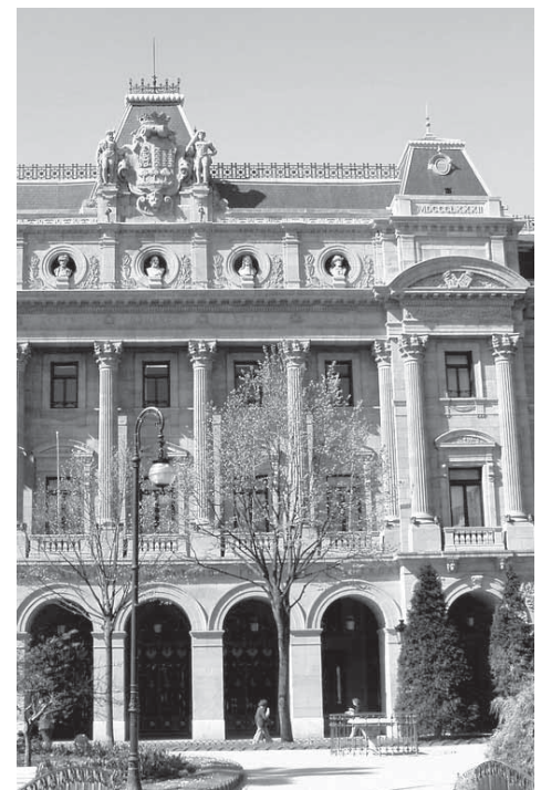
Les diputaciones collectent la totalité des impôts.

En conclusion, les autonomes péninsulaires sont en ébullition et exigent les mêmes prérogatives qu'en Navarre ou en Euskadi. Des partis tels que Ciudadanos remettent en cause l'organisation administrative et financière de l'Etat espagnol et souhaitent recentralisation et standardisation. Aucune mesure significative ne freine la corruption au sein des deux grands partis se succédant au gouvernement.