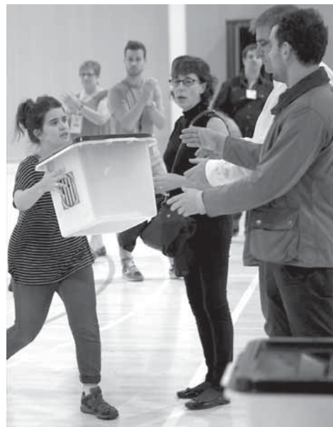
6.000 urnes ont surgi le matin du 1 er octobre.

bureaux de vote où les gens ont passé la nuit pour empêcher leur fermeture. Il faut s'imaginer ce qui se passe dans la tête et les tripes des millions de gens tentant de voter malgré les charges et les violences policières, des vieux et des jeunes pleurant de joie quand ils parviennent dans ce contexte à glisser leur bulletin dans l'urne, tout cela laisse des traces en profondeur dans une société. Comme l'écrit le militant et