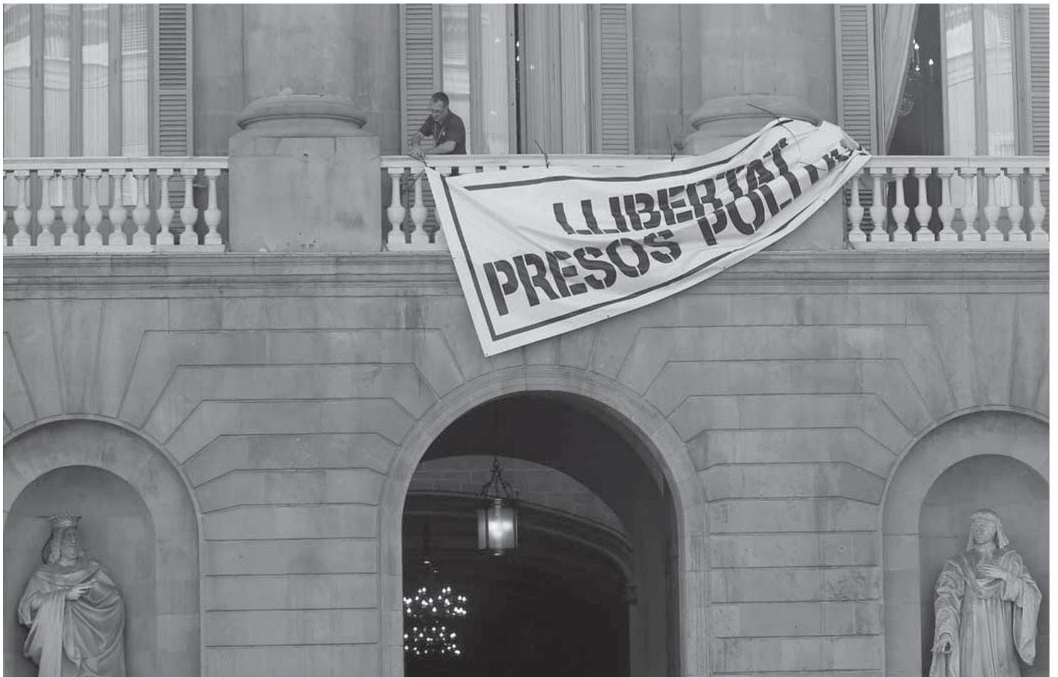
Le 26 novembre, la Commission électorale exige la dépose du panneau réclamant la libération des prisonniers politiques catalans du fronton de la mairie de Barcelone.