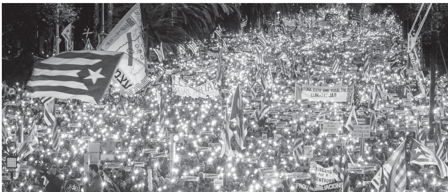
Le 11 novembre, 750.000 personnes sont descendues dans les rues de Barcelone pour réclamer la libération des 10 prisonniers politiques catalans.