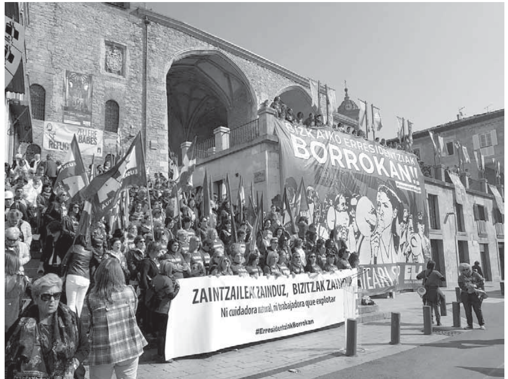
"Zaintzaileak zainduz, bizitzak zaindu - ni soignante naturelle, ni travailleuse à exploiter".

Pour tenir 370 jours de grève, il faut aussi une solide logistique, qu'assure le syndicat ELA, majoritaire au Pays Basque, avec