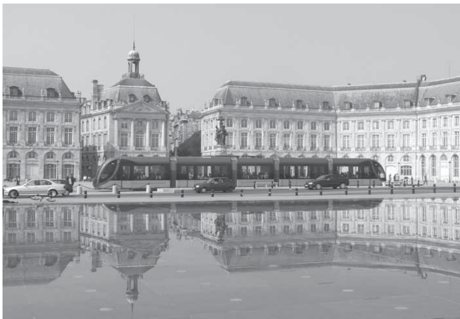
Les CCI locales sont menacées au profit des régionales, comme celle de Bordeaux.