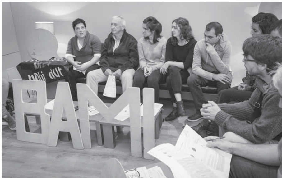
BAM! egitasmoaren ekintzak aurkeztu dituzte sortzaileek.

Aspaldikoak dira euskararen erabilpena sustatzeko ekintzak, izan herri mugimenduen eskutik nahiz instituzioen aldetik, eta begi bistakoa da hainbat alorretan emaitzak lortu dituztela. Euskaraldiaren berezitasuna dimentsio psiko-soziologikoan zentratzea da. Euskaldun orok, izan zaharra ala berria, osoa ala ez, bizitzen dugun stress linguistikoa du abiapuntua, hizkuntza ohiturak aldatzeko gainditu behar dena hain zuzen. Erran nahi baitu ingurune ezagunetik kanpo euskaraz noiz egin, noiz egin, zein erreakzio sortuko duen sekulan ez jakitea. Euskal Herrian toki, egoera eta momentu gehienetan erdaraz aritzeak "norma" izaten segitzen du. Euskaraz aritzea aldiz norma honetatik aldentzea da, norma berri bat sortzeko. Euskaraldiak helburu zehatza du beraz: euskaltzale helduak aktibatzea eta prestatzea, beren eguneroko harremanetan euskaraz aritzeko ulertzen duten herritar guzietan.