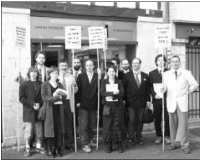
À Bayonne le 28 mars 2006, une action symbolique parodiant les véritables intentions du patronat quand au CPE: « Oui au CPE de 7 à 77 ans! »