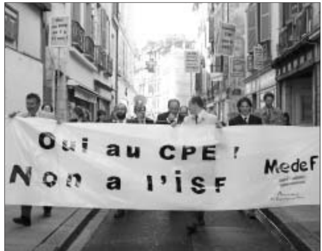
Enfin, le MEDEF dit tout haut ce qu'il pense vraiment!