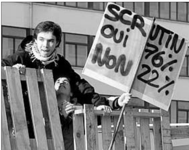
Occupation du lycée Cassin à Bayonne, votée par 76% des lycéens.