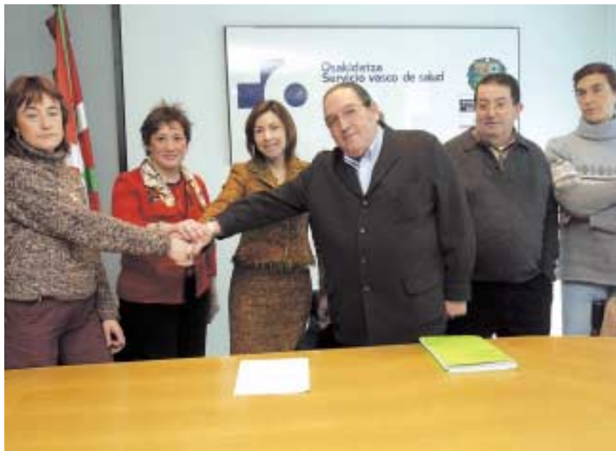
Foto de familia de los representantes de Osakidetza, LAB, CC OO y UGT durante la firma del acuerdo minoritario.

A LAB le queda, eso sí, un discurso más agresivo; CC OO y UGT hablan de manera explícita de la importancia de la competitividad y de la negociación colectiva al servicio de la competitividad. Evidentemente, LAB no está en ese discurso, pero en la praxis no hay diferencia. Y la prueba es cómo se van concretando las firmas de los