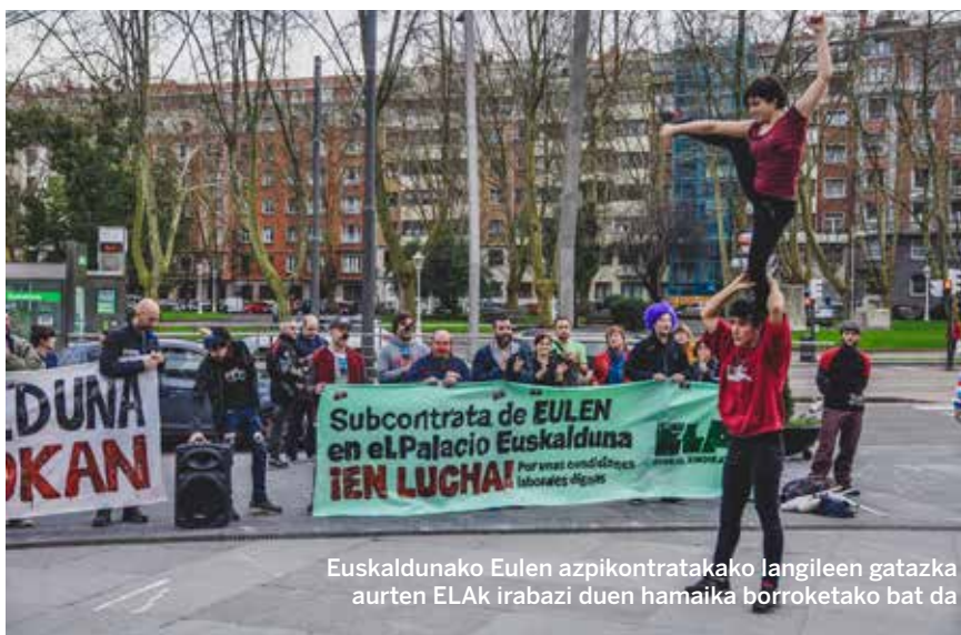
Euskaldunako Eulen azpikontratakako langileen gatazka aurten ELAk irabazi duen hamaika borroketako bat da

Han sido muchos –iy buenos!– los acuerdos firmados este año, tanto en sectores como en empresas