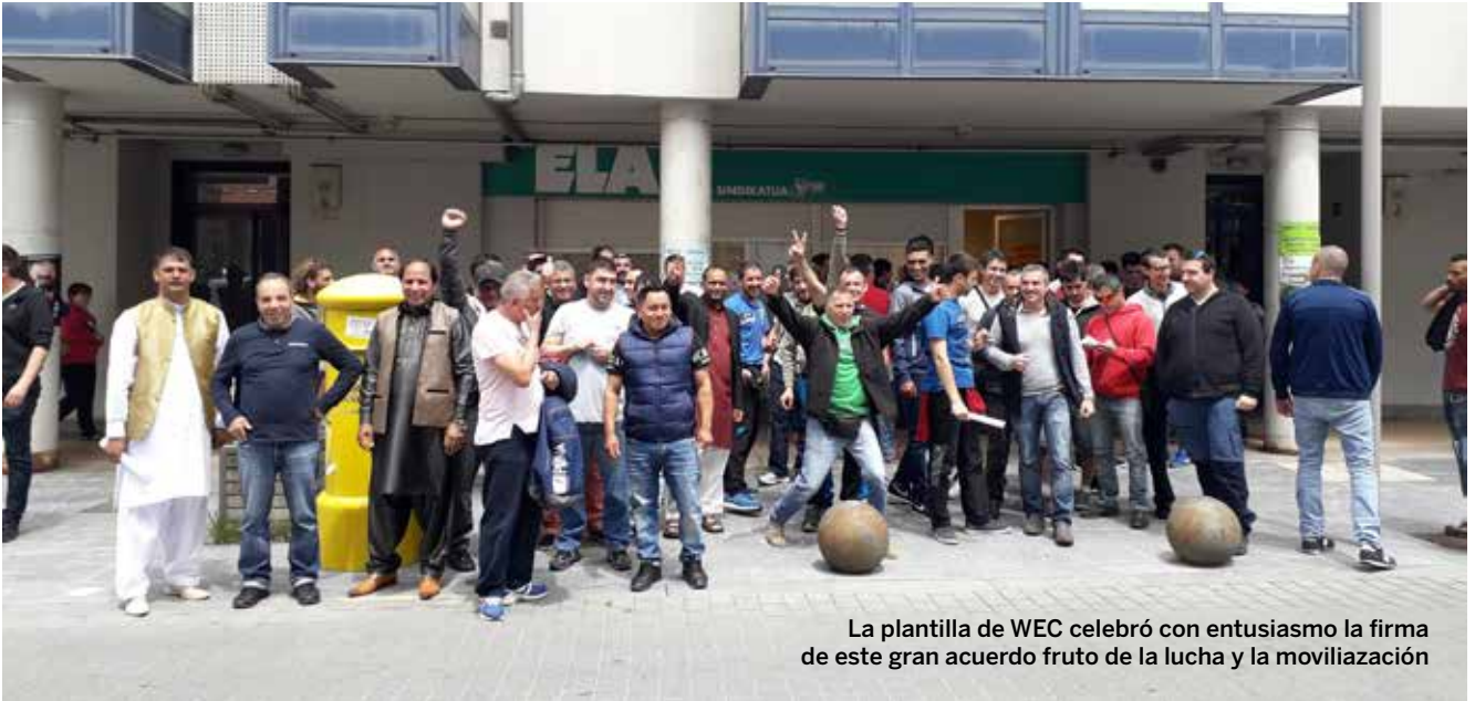
La plantilla de WEC celebró con entusiasmo la firma de este gran acuerdo fruto de la lucha y la movilización

Tras 12 días de huelga logran mantener el convenio de empresa así como mejoras en vez de recortes, como pretendía la dirección