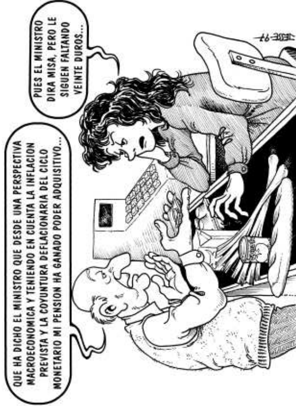
Landeia, 1997-09 Gazteak ez dira larri dabiltzan bakarrik.

En 2006, sobrevivir sigue siendo un problema para mucha gente.