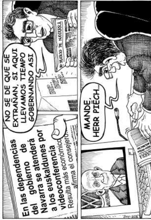
Landeia, 2002-02 Nafarroan norik agintzen duen inor zalantzarik balu.

Hace tiempo que en Navarra manda la Volkswagen. La dependencia de las multinacionales es un problema estructural de la economía navarra.