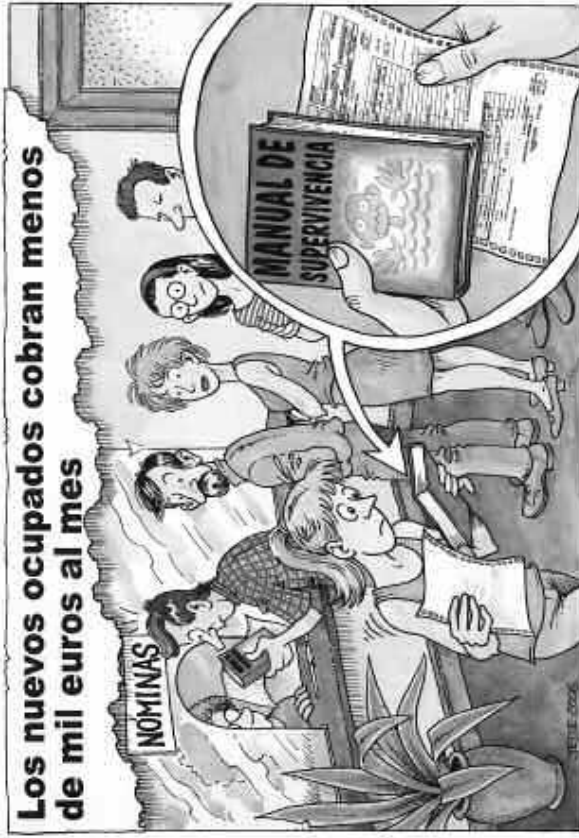
Landeia, 2006-10 2006 ere, askok gorriak ikusi behar dituzte aurrera egiteko.

En 2006, sobrevivir sigue siendo un problema para mucha gente.