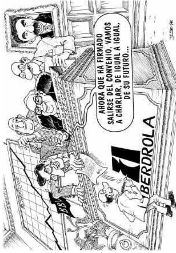
Landeia, 1996-10 Lan hitzarmenak indargabetzea eta kondizioak banaka negoziatzea nahi dute ugazabek, ondotxo baitakite banakako harremanean jaun eta jabe direla.

La "ayuda" que nos hace más fuertes en la negociación colectiva.