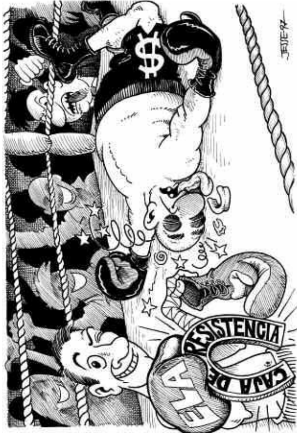
Landeia, 1997-07 Greba kutzaren indarrak negoziazio asko erabakitzen ditu.

La "ayuda" que nos hace más fuertes en la negociación colectiva.