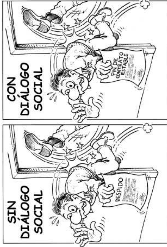
Landeia, 2005-05 Non dago aldeia?

No es fácil ver las ventajas a un diálogo social que facilita el despido.