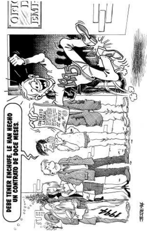
Landeia, 1995-01 Urte berri, arazo zahar.

En 1994, sólo el 2% de los nuevos contratos fue indefinido.