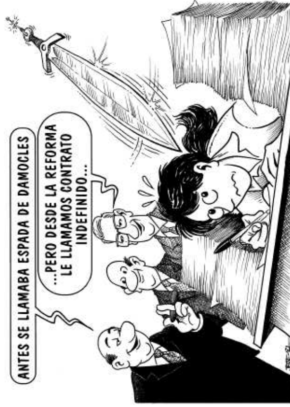
Landeia, 1997-06 Badakigu zein egoeratan geratzen den langilea kaleratzea errazten denean

Es la situación a que reduce al trabajador o trabajadora un régimen de despido libre con baja indemnización.