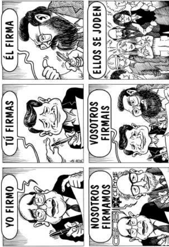
Landeia 1997-05 Lan erreformaren aditza jokatzeko.