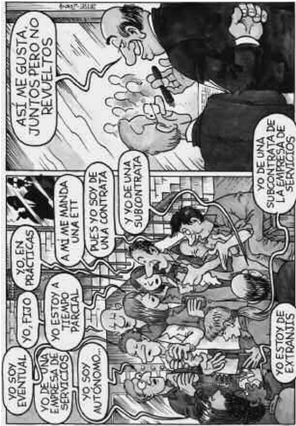
Landeia, 2004-03 Ugazabek argi daukate.

Divide y vencerás, la patronal lo tiene claro