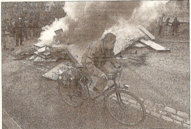
Un colectivo pasa junto a una barricada en llamas de activistas anti OTAN, ayer, en Estrasburgo.

tos de protesta se registraron en el barrio de Neuhof. Los manifestantes, unos 300, se enfrentaron a las fuerzas del orden que lograron dispersarlos haciendo uso de cañones de agua y gases lacrimógenos. Según pudo confirmarse EL MUNDO, también hubo disturbios a primera hora de la mañana cuando un número indeterminado de activistas, acompañado en las afueras de la ciudad, atacó con piedras un acuartelamiento del Eurocuerpo. Las fuerzas del orden se encontraron en estado de máxima alerta a la espera de la gran manifestación que se ha convocado para las 13.00 horas de hoy.