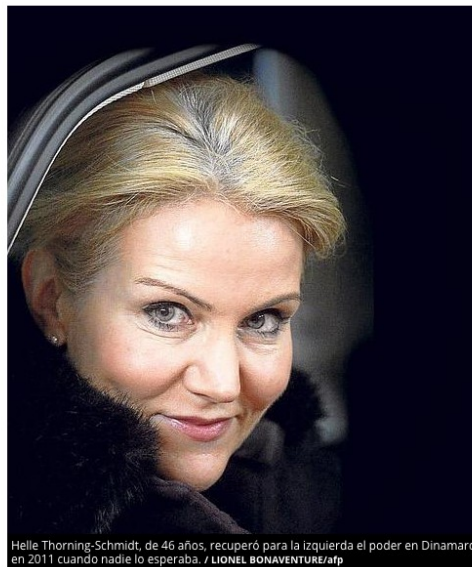
Helle Thorning-Schmidt, de 46 años, recuperó para la izquierda el poder en Dinamarca en 2011 cuando nadie lo esperaba.

Es más que probable que Helle Thorning-Schmidt, de 48 años, sea la única jefe de gobierno del planeta que ha logrado que, al menos durante un tiempo, las búsquedas en Google que llevaban su nombre fueran acompañadas de la palabra 'desnuda'. Ocurrió en 2011, en plena campaña electoral, cuando la candidata disputaba a Lars Lokke Rasmussen la presidencia del Gobierno danés. Helle no solo venció a su contrincante –aunque fuera por poco–; devolvió el poder a la izquierda después de diez años y demostró que, además de despertar el morbo de sus compatriotas, ser guapa y elegante, era una mujer inteligente.