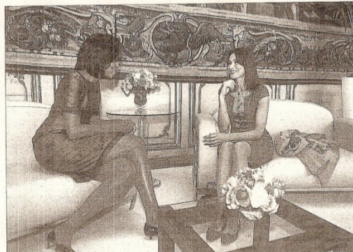
La primera dama de EE.UU., Michelle Obama, conversa con su homóloga francesa, Carla Bruni-Sarkozy, ayer en el Palacio Rohan, en Estrasburgo.