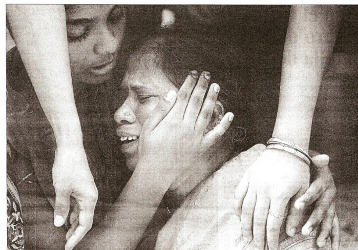
Un familiar llora a una de las personas fallecidas en los ataques terroristas en Bombay.