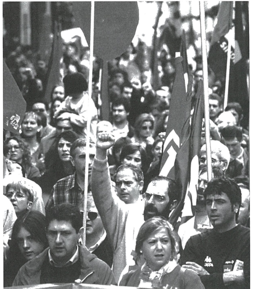
Si todavía no tienes la txartela del 1 de Mayo, acude a tu responsable sindical o al local más próximo. No puedes faltar a la cita.

Oraindik ere txartelak eskuratu ez badituzu, jo ezazu zeure eskualdeko arduradunengana, joan-etorria antolatu ahal izateko.