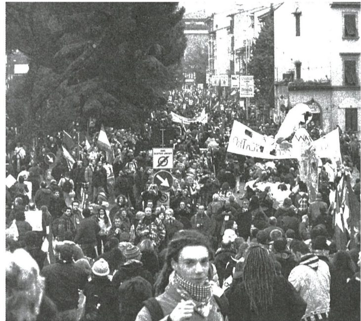
I Gizarte Foroa zela-eta Florentzian egin zen manifestazioa.