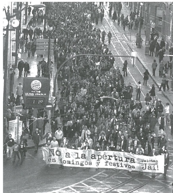
La protesta contra la apertura en festivos ha ido aumentando.

Tras el paro de tres horas del pasado 28 de enero, ELA anima al personal de la residencia Uribarri de Durango a que se prepare para los paros convocados para los días 23 y 24 de Febrero y para la manifestación del día 25. El día 28, las trabajadoras se concentraron ante el Palacio Foral, y estuvieron acompañadas por militantes de los tres sindicatos convocantes del paro. Al finalizar la concentración las trabajadoras denunciaron la actitud del Diputado de Bienestar Social Juan M o Aburto, que desde que comenzaron las movilizaciones no se ha dignado a dar la cara.