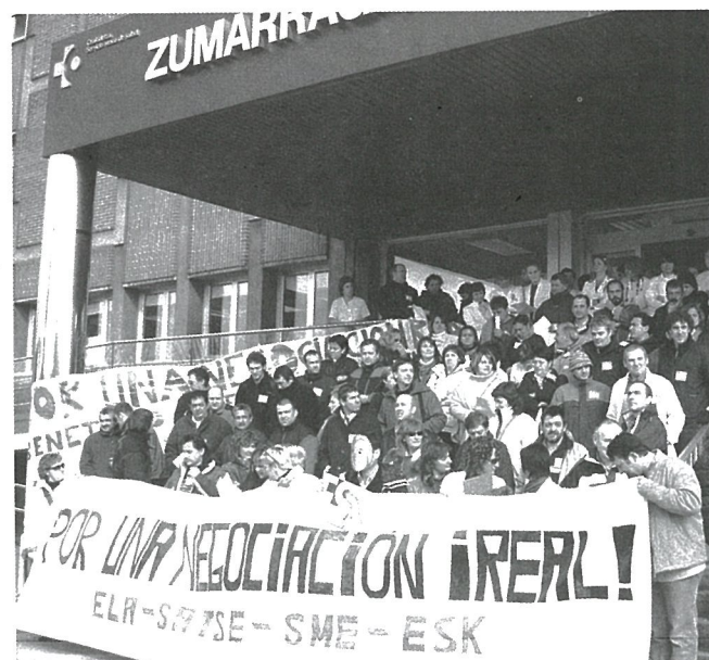
En la foto, la concentración del hospital de Zumarraga.

En el ámbito hospitalario, la actividad asistencial ha quedado reducida a la atención a los pacientes ingresados y al servicio de urgencias, por lo que el paro ha alcanzado el 65% del