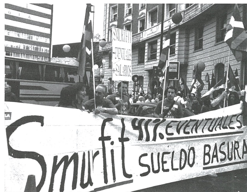
ELA intenta acotar la temporalidad existente a través de los convenios de empresa.

1.-La temporalidad y su utilización abusiva: Para la patronal la temporalidad es un elemento de ajuste de costes salariales que tiene como objetivo la existencia de unas peores condiciones y aumentar los beneficios. La temporalidad afecta de manera determinante en el reparto de la riqueza. Debilita el peso de las rentas salariales. La patronal no quiere perder la posición de ventaja que tiene en este tema, siendo la causa principal del conflicto. Llama la atención que el cambio de coyuntura económica no haya repercutido en la variable temporalidad. El resultado evidente es el comportamiento de los beneficios empresariales, el reparto más injusto de la riqueza y