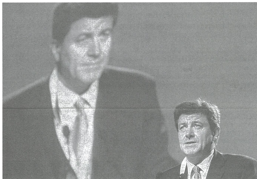
Guy Ryder, secretario general de la CSI en su intervención en el congreso fundacional

Las razones para su fundación son claras: "Más que nunca en su historia, confrontado a una globalización capitalista sin freno, el internacionalismo efectivo resulta esencial para el futuro refor-