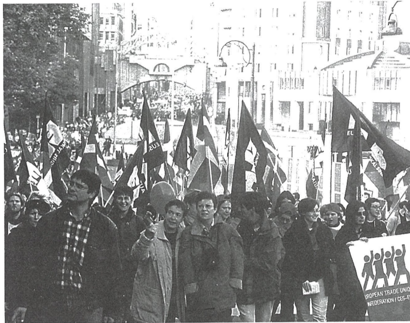
Arriba, un momento de la manifestación en Bruselas; portuguesas y vascas confraternizan antes de salir de viaje, y dcha., la pancarta de la CES.