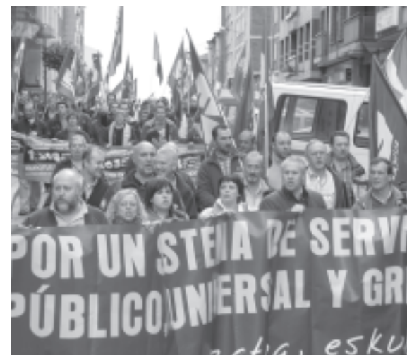
Por un sistema de servicios sociales público, universal y gratuito. Zaindua izatea, eskubide. Bajo ese lema en Ibaizabal-Nerbioi se denunció que son muchas las personas que quedan excluidas de los servicios sociales.