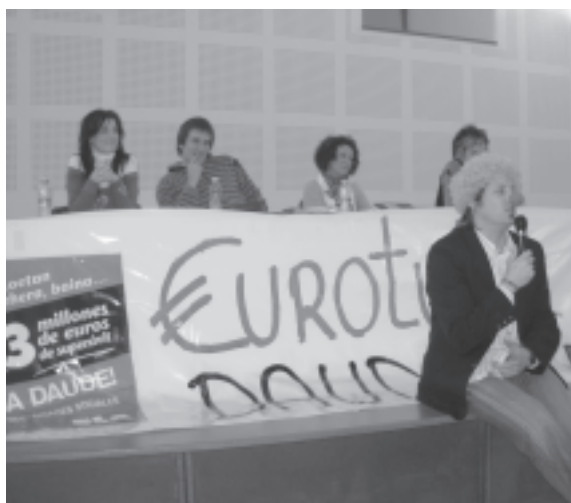
La sanidad fue el tema que abordaron en la comarcal de Deba. Se denunció la privatización de la sanidad pública y se exigió una mayor inversión en Osakidetza.