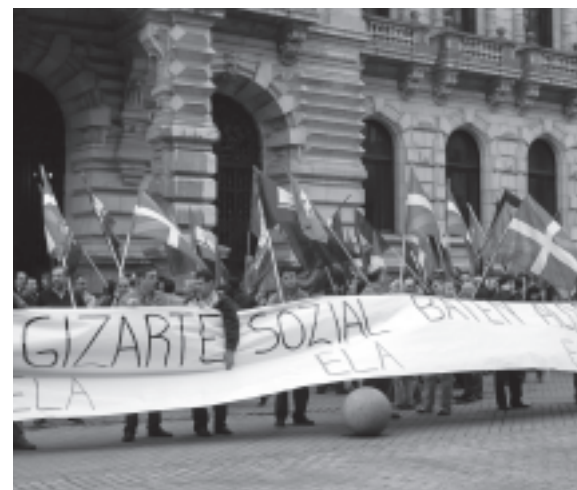
En Bilbao ELA trató de socializar la necesidad de un cambio de rumbo en la gestión de los servicios sociales.