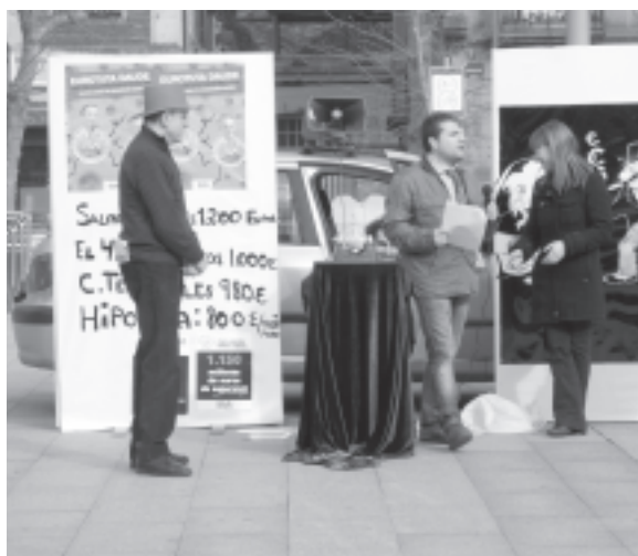
Los militantes de ELA en Oarso-Bidasoa realizaron una divertida parodia en la Plaza Ensanche de Irun para denunciar las políticas de vivienda de la Administración.

Recordar, asimismo, que el acto final de esta campaña tendrá lugar el próximo 15 de febrero a las 9:30 de la mañana en el Pabellón de los Deportes de la Casilla, de Bilbao. Tras diversas intervenciones, los miles de delegados/as y militantes de ELA allí congregados se dirigirán en manifestación hasta la Plaza Circular. ¡No faltes!