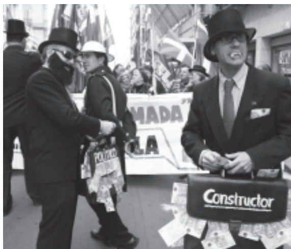
Constructores, banqueros y políticos pasearon de la mano por las calles de Donostia en una parodia que quiso mostrar los múltiples y oscuros intereses que hay detrás del ladrillo.