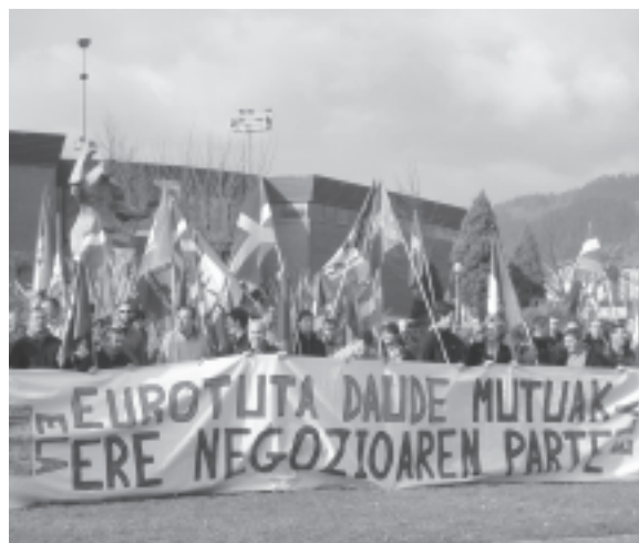
En Urola-Kosta se quiso denunciar los enormes beneficios que obtienen las mutuas gracias a la cada vez mayor privatización que padece la sanidad pública.