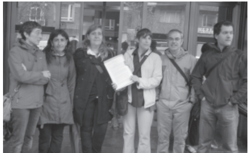
La mayoría sindical vasca registró el pasado 16 de junio la convocatoria de huelga general

GURE ESKUBIDEAK DEFENDATZEKO! ¡Basta de imposiciones!