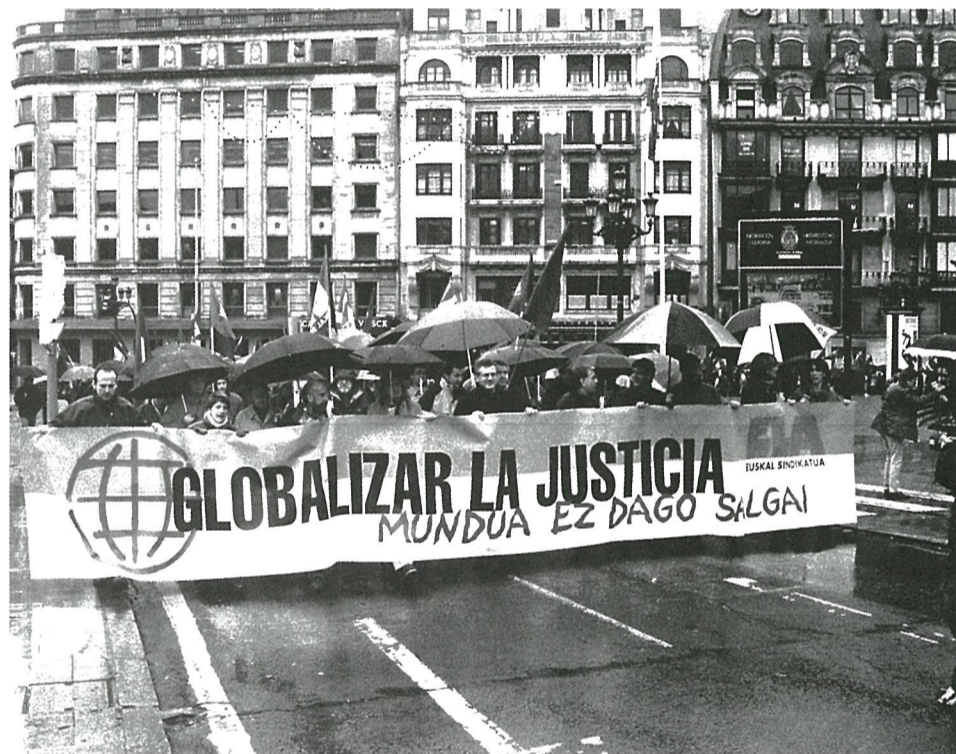
Arriba, un instante de la manifestación del viernes contra la Cumbre de Qatar. A la derecha, un momento del acto previo en la Biblioteca Bidebarrieta.

Baina gainera, MMEren biltzar honetako helburuak gizarte osoarentzako dira arriskutsu: neoliberalen asmoak muturreraino eramanez gero, herri bakoitzean zein elikagai eta nola ekoizti erabakitzea ere galaraziko lukete; osa-