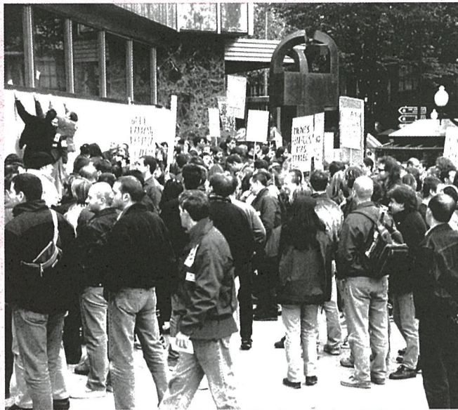
El jueves, los trabajadores de Gamesa se trasladaron a Bilbao para concentrarse ante la sede del BBVA.

-Hemos presentado una batería de propuestas que harían posible el mantenimiento de todos los empleos. Destacan la reducción de la jornada laboral a 35 horas, adecuando el empleo a dicha reducción y las suspensiones temporales de contratos con reingreso en la empresa en el plazo de 6 meses y con garantía del 90% del salario.