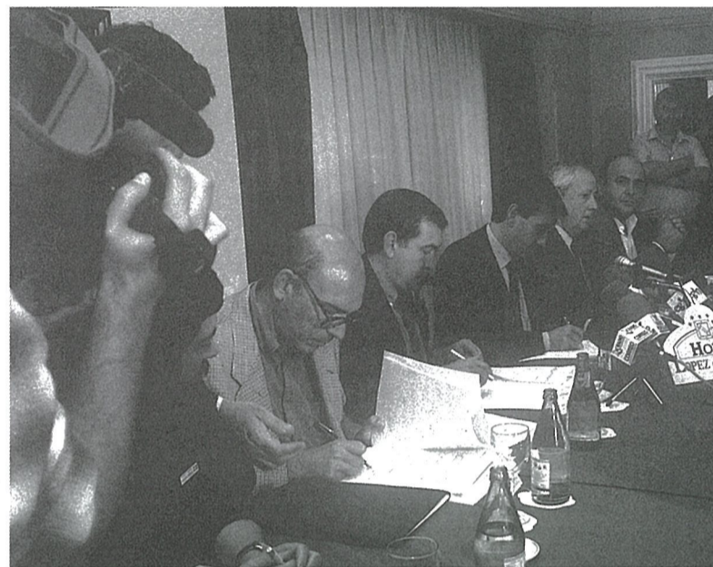
Etengabeko prestakuntzari buruzko akordioaren sinadura.

Halaber, Eusko Jaurlaritzari eskatzen diogu hitzetatik ekintzetarako urratsa egin dezala, eta den egoera dela ere, Hobetuz finantzatzeko bermea eman dezala, behar izanez gero Esta-tuari ordaindu beharreko Kupotik kenduta.