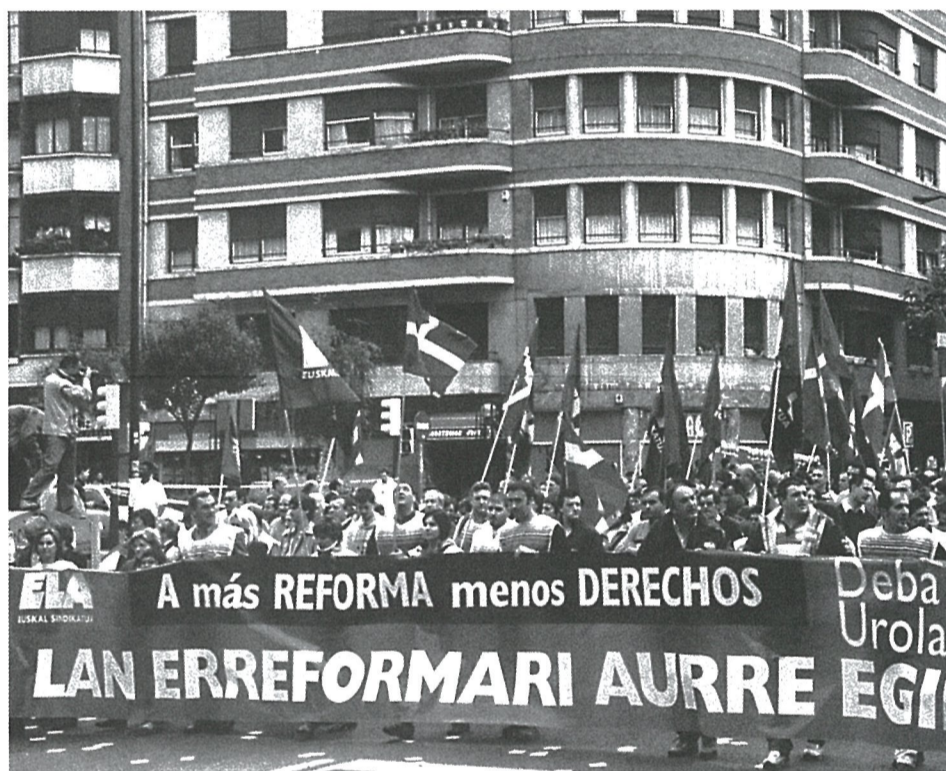
Pancarta contraria a la reforma que prepara el PP.

—En su línea habitual, cuando el gobierno español habla de "reforma", plantea en realidad una nueva reducción de derechos. Esta ha sido, aunque disfrazada de otras intenciones, la constante de las sucesivas reformas