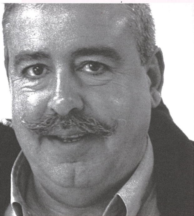
(viene de la página 1)

–También habéis denunciado los altos niveles de inflación que soportan los navarros/as.