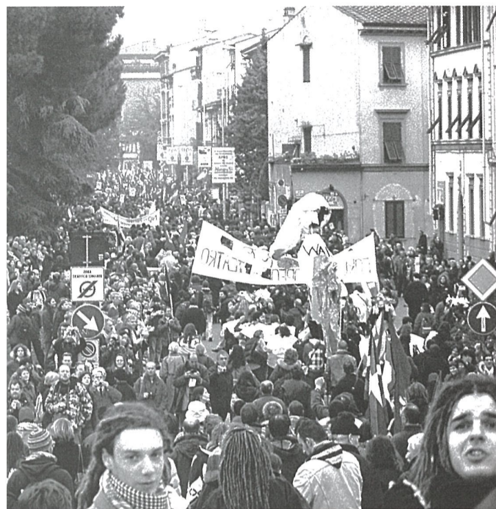
Florentziako manifestazioa erraldoia izan zen.

Dena den, lan honek ez lituzke lehen aipatutako mobilizazioak bultzatzeko unean uneko aliantzak baldintzatu behar.