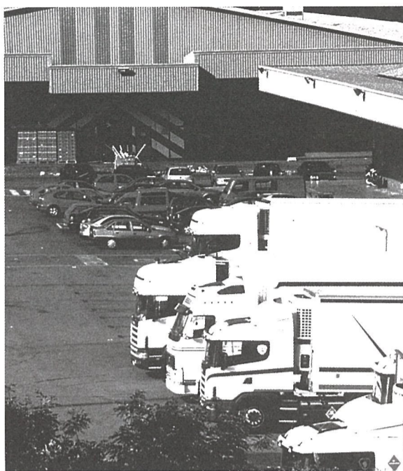
Una vista de Mercabilbao.

En el resto de la comarca, a ELA le toca defender una mayoría de peso, con porcentajes que van del 42,4% de Aiala al 50% de Orduña o la zona de Galdakao-Arratia. El crecimiento global ha sido espectacular en estos veinte años: “En 1980 partíamos del 26%, y ahora estamos en el 45,5%; ¿qué ha pasado? Que organizaciones como SU, CSUT y USO han desaparecido, o casi, y que ELA se ha llevado toda esa representación”.