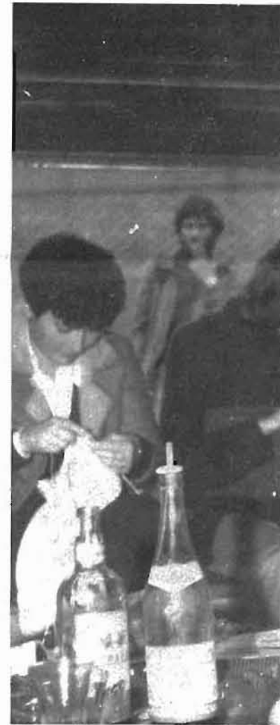
Tavesa, Algodonera, Lasagabaster, I