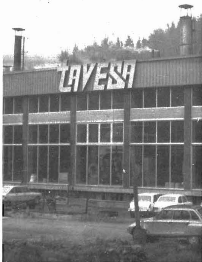
La Delegación de Trabajo, a favor de los patronos.

La decisión del delegado de Trabajo no fue nada imparcial, sino que supuso un duro golpe a los trabajadores y una postura de reforzamiento de los patronos; por esto retira-