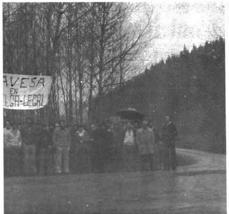
avesa han visto el verdadero rostro del empresario.

brando el 75 % del seguro de desempleo. De la empresa Narbaiza, la mitad de los trabajadores en la calle.