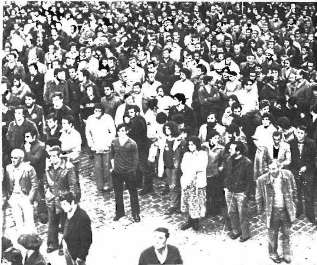
La respuesta de los trabajadores de Euskadi fue unánime al llamamiento de la CES. En la foto, la concentración realizada en Pamplona.