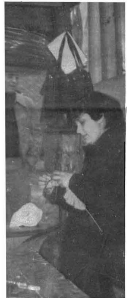
expedientes de crisis.