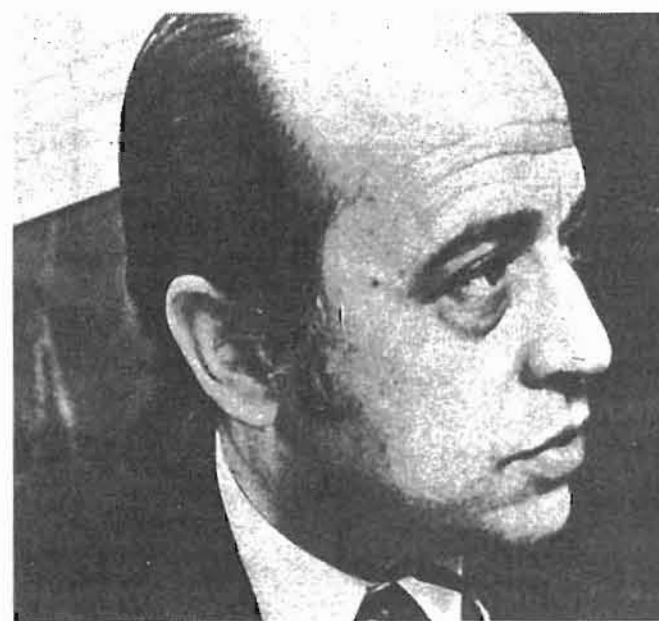
Fernández Ordóñez, el ministro de la Reforma Fiscal.

sindical, tal y como está redactado, pone en peligro la economía de mercado, carecen de razones y son conscientes de que en realidad el riesgo es inexistente. Cuando la patronal señala la dificultad de simultanear la salida a la crisis con la reforma fiscal, cuando pretende aplazarla aludiendo ra-