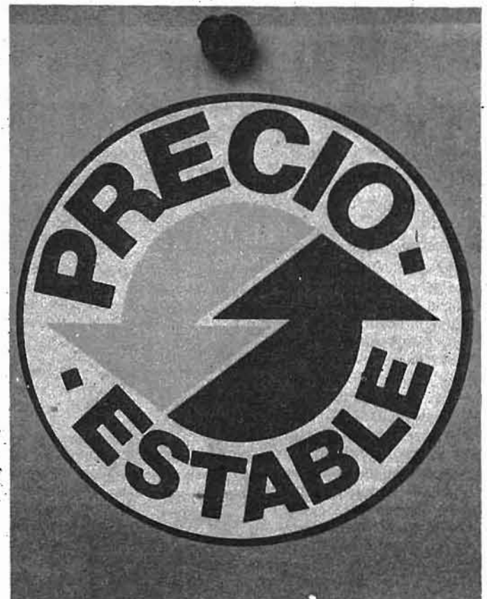
Los 60 millones de publicidad en la campaña del precio estable, un truco que a nadie ha convencido