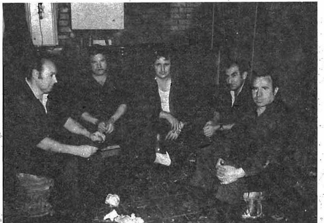
Para los trabajadores, la reestructuración no pasa por los despidos

Galindo 21-4-1978 Sección Sindical de ELA-STV de la BABCOCK WILCOX