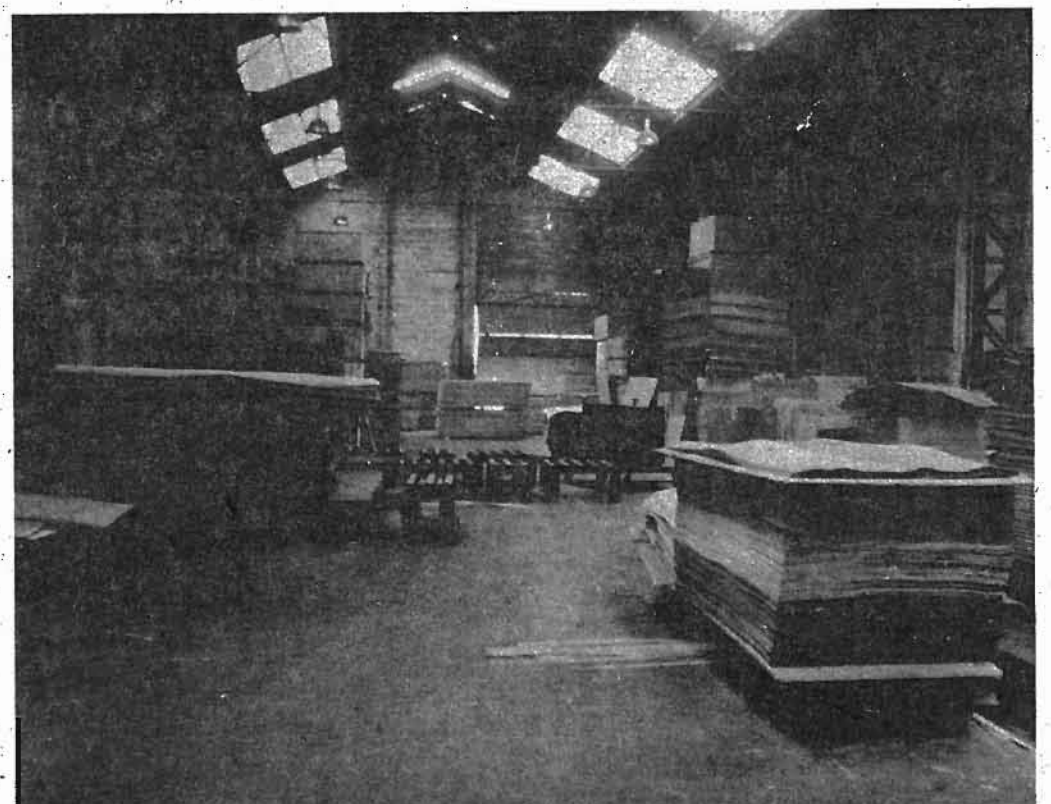
"Denok lanean hasi eta negoziaketak ekingo ditugu, herri mailan", diote nagusiek