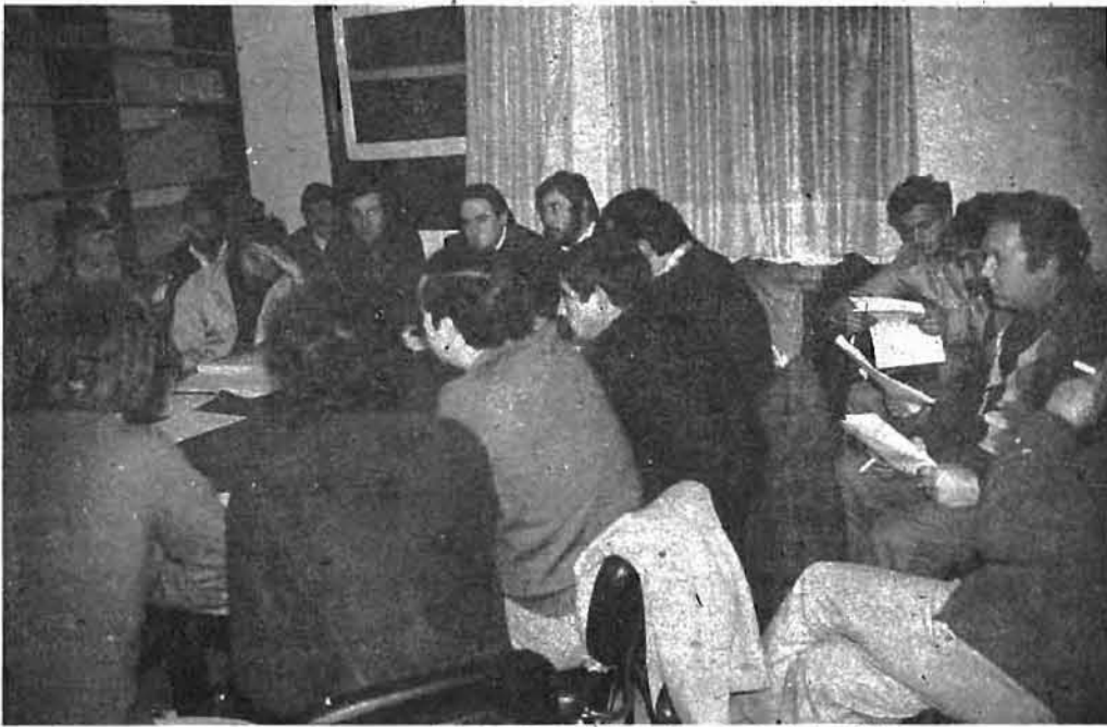
En la foto, una de las reuniones mantenidas por la Sección sindical de ELA