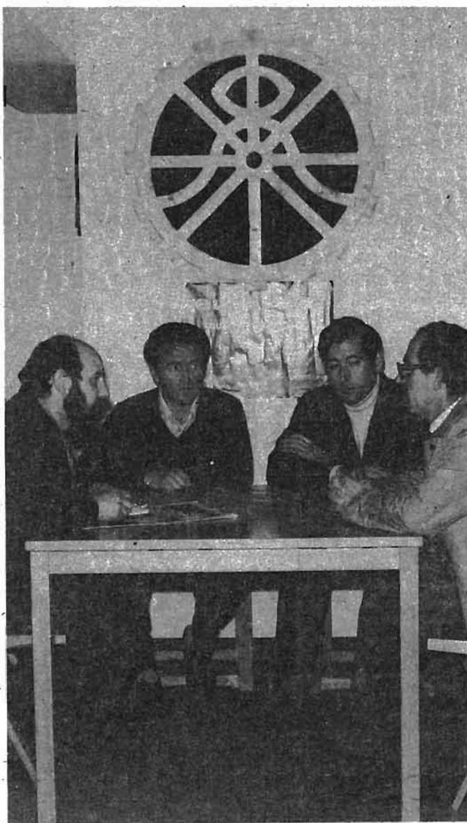
Los patronos quieren destruir el sindicalismo en la empresa y alejar de su marco natural, toda reivindicación o conflicto

Lo que no podemos caer es en la trampa de terminar los conflictos y sentarnos a un pacto local, con las consecuencias antes citadas, a lo que los patronos están inten-