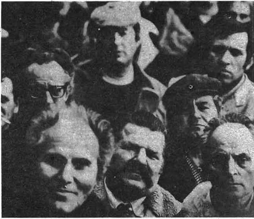
El IX Congreso del PCE