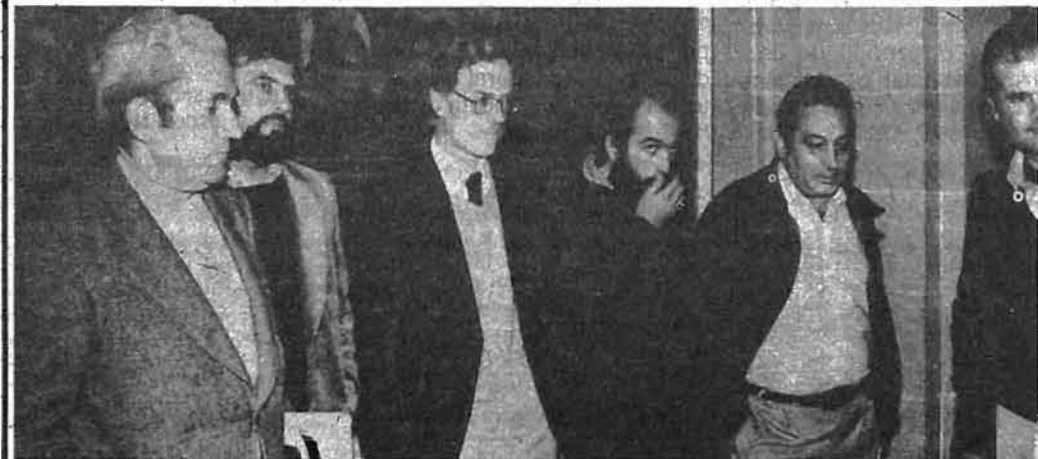
Líderes de UGT y CC. OO. haciendo antesala para ser informados. Escena muy frecuente en el último periodo. La acción reivindicativa sigue mientras tanto congelada

Según un informe preparado por los expertos del Partido Conservador de Gran Bretaña, en la hipótesis de que este partido gobierne sería incapaz de controlar a los sindicatos en una confrontación directa. La conclusión, que tiene motivos para alarmar al partido presidido por Margaret Thatcher, se fundamenta en la fortaleza de la TUC y la avanzada tecnología controlada por ellos en determinados sectores. Según los redactores del documento, la derrota del primer Heath en 1974 fue debida precisamente a la primera manifestación de esta fuerza de los sindicatos.