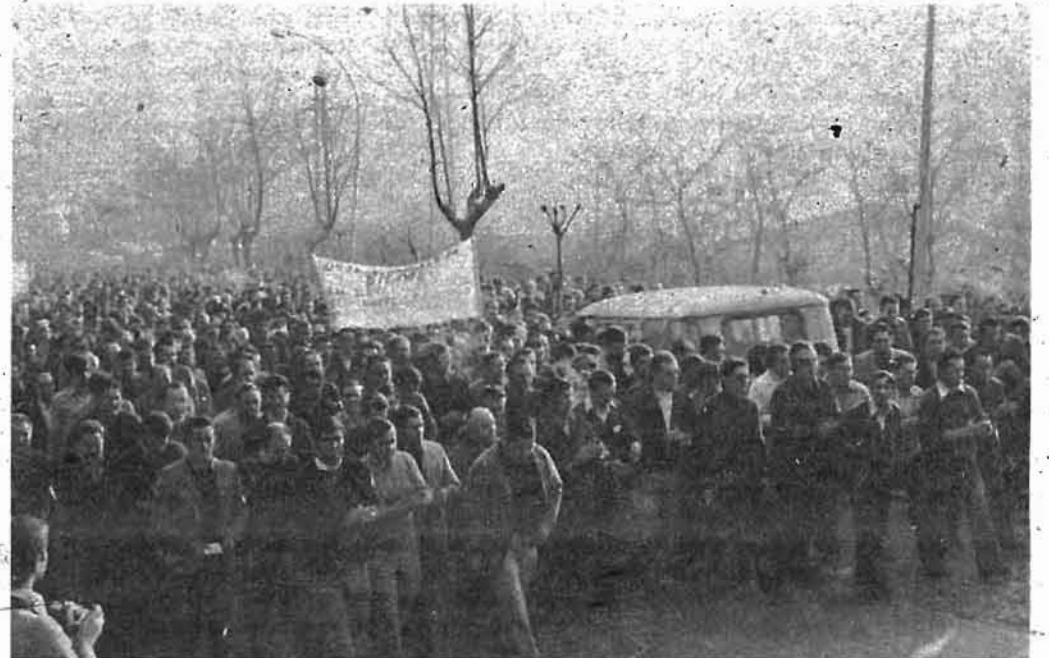
En la foto, la manifestación se dirige por la cuesta de Galindo hacia Sestao

D) Por lo que respecta al cuarto punto, "Dar entrada a las Secciones Sindicales", o lo que es lo mismo, las Centrales Sindicales operantes en la empresa, es nuestro pilar básico