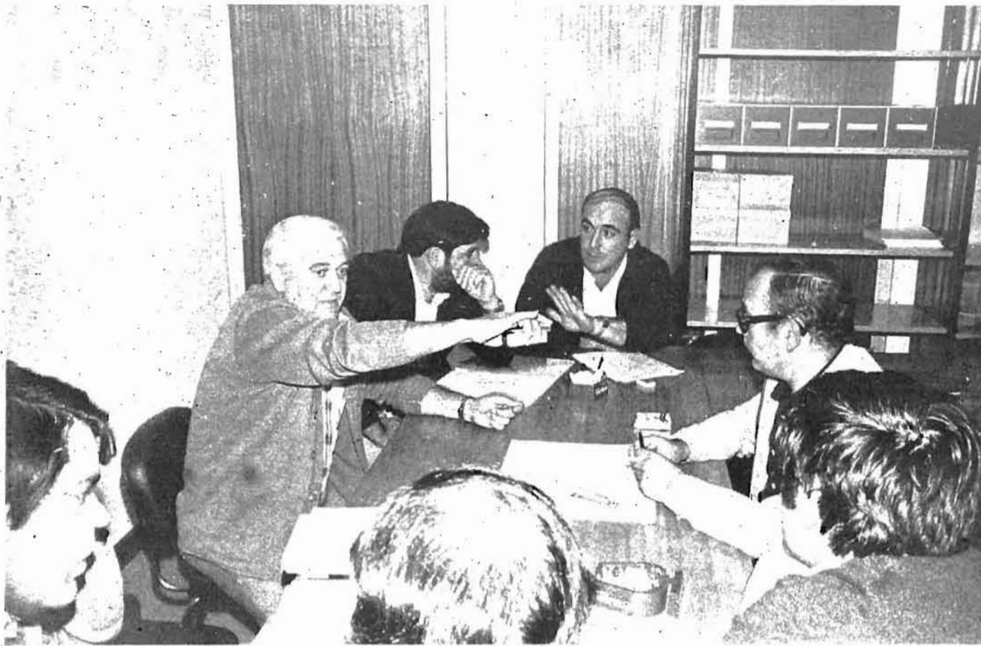
Astilleros, S. A.

Estas son las centrales que apoyan la manifestación: ELA-STV, UGT, CNT, LSB-USO, CC. OO., CSUT, SU, LAB.