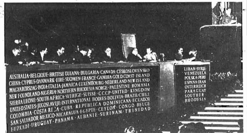
1945 = Parisen, FSMeko Batzar Nagusi Fundatzailea ELA, hau ere, Euskal Herriko Langileen ordeko egon zen

debate sindical que se encierra en los límites nacionales o estatales. Dentro de Europa ni nosotros, los italianos, ni la DGB, ni los Trade Unions no podemos, aislados, resolver positivamente el problema del empleo. Es necesario un internacionalismo de tipo nuevo, abierto y dinámico: Los modelos de antiguos no sirven. Es también naturalmente importante reanudar un diálogo con el sindicalismo americano, que es una realidad de gran significación y una realidad que no está inmóvil, sino que es sacudida por fuertes tensiones renovadoras.