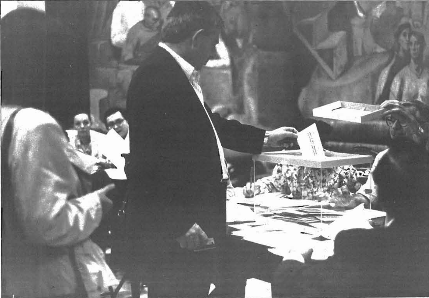
El pasado jueves se celebraron las elecciones en la Diputación vizcaina. ELA logró mayoría absoluta entre los funcionarios, y se destacó también en los laborales