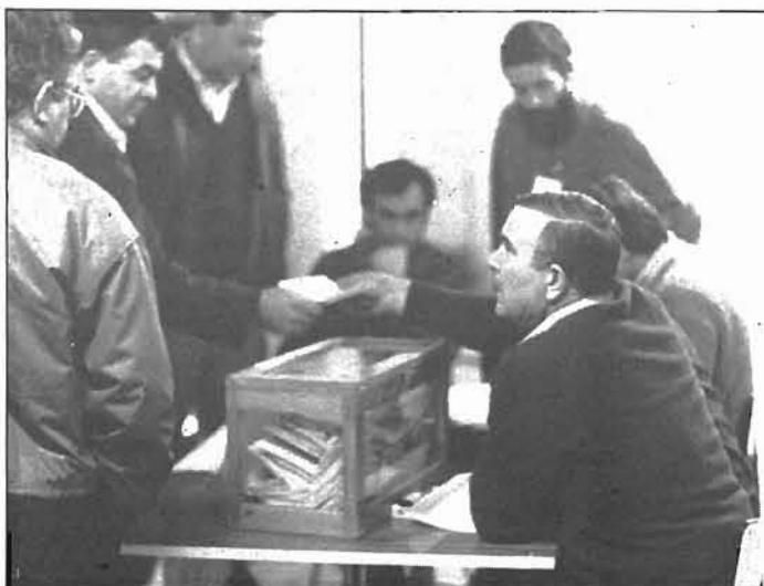
«La actitud de la Administración navarra con sus trabajadores es impresentable»

G URE kandidatoak» va a ser una sección fija en ELA-Astekaria durante todo el período electoral. A través de ella pretendemos convertirnos en tribuna de una parte representativa de los numerosos candidatos, mujeres y hombres de todos los lugares de Euskadi, que se presentan a las elecciones en las listas de ELA, acercando así su trabajo diario y sus problemáticas específicas a todos los trabajadores.