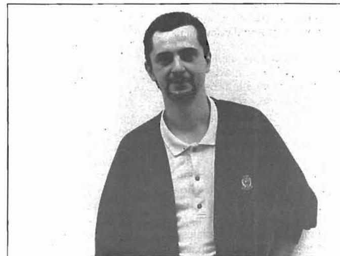
«Una ELA fuerte beneficia a todos los trabajadores»

Objetivos todos ellos por los que van a luchar durante los próximos años, sin olvidarse, eso sí, de hacer de ELA el sindicato mayoritario también de Sanidad.