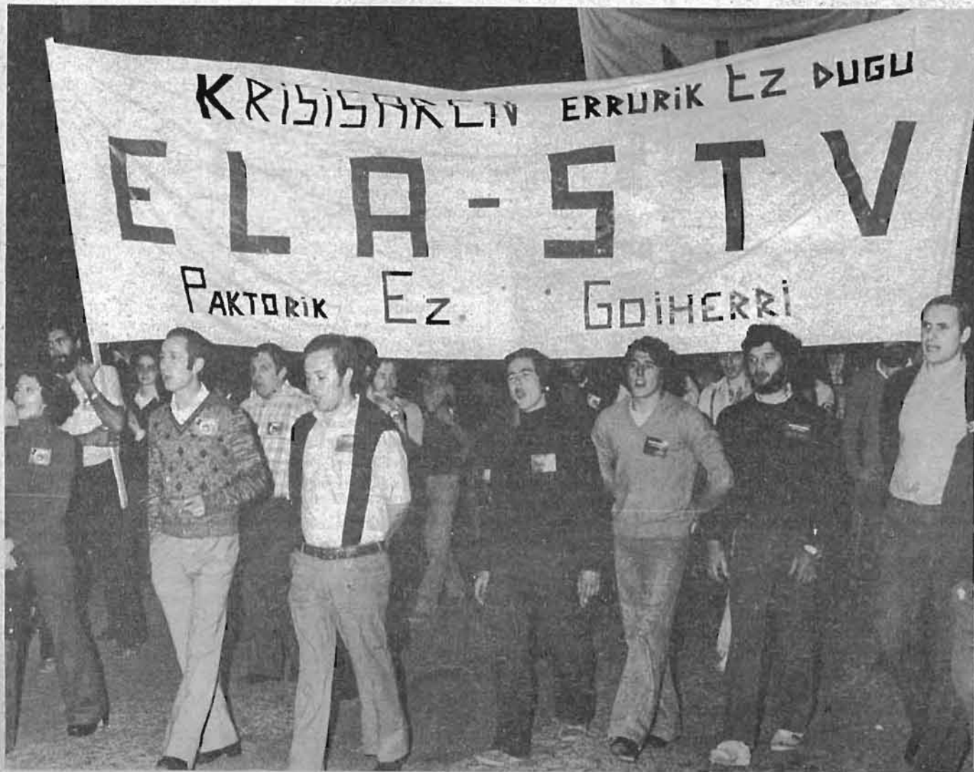
El grito de 80.000 trabajadores