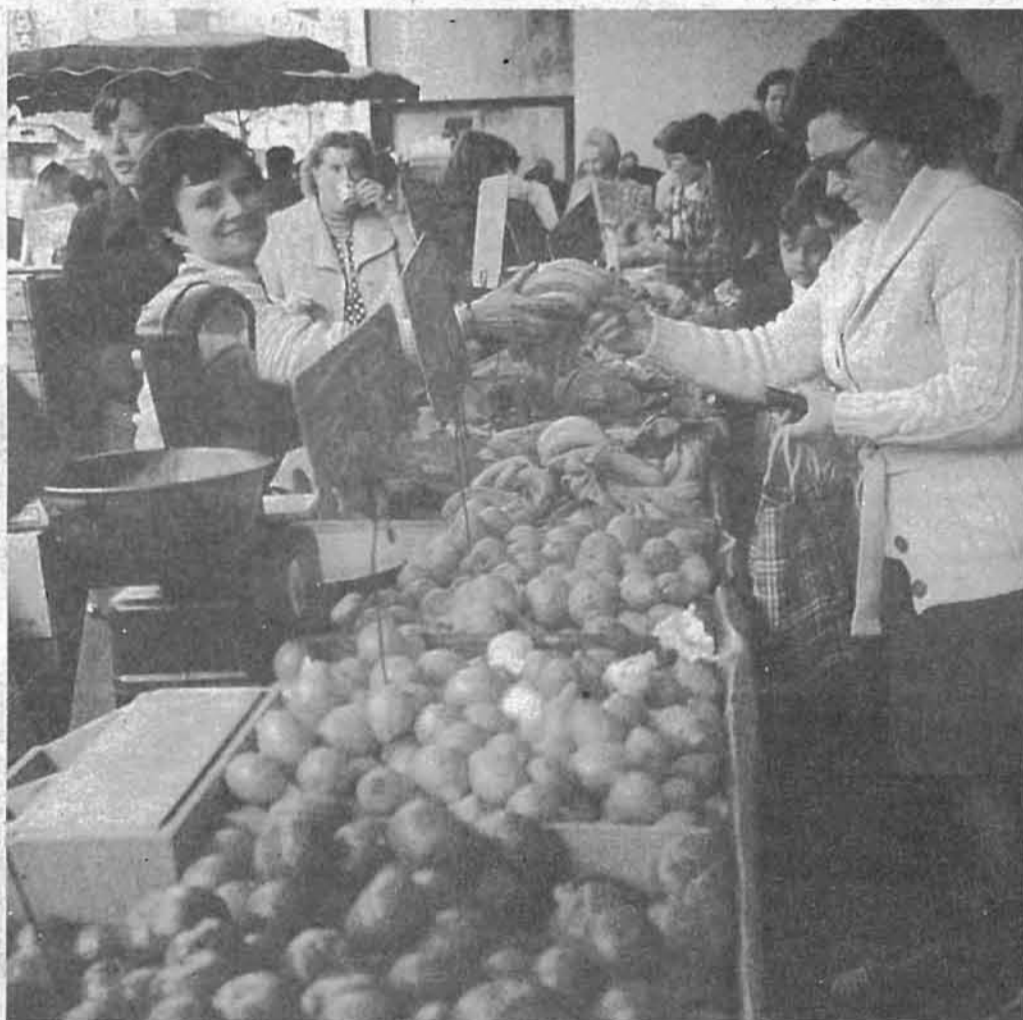
En 1978 los salarios podrán comprar menos

Las dotaciones al crédito oficial serán de 190.000 millones, de los cuales el Tesoro aportará 40.000. La atención preferente será exportación,