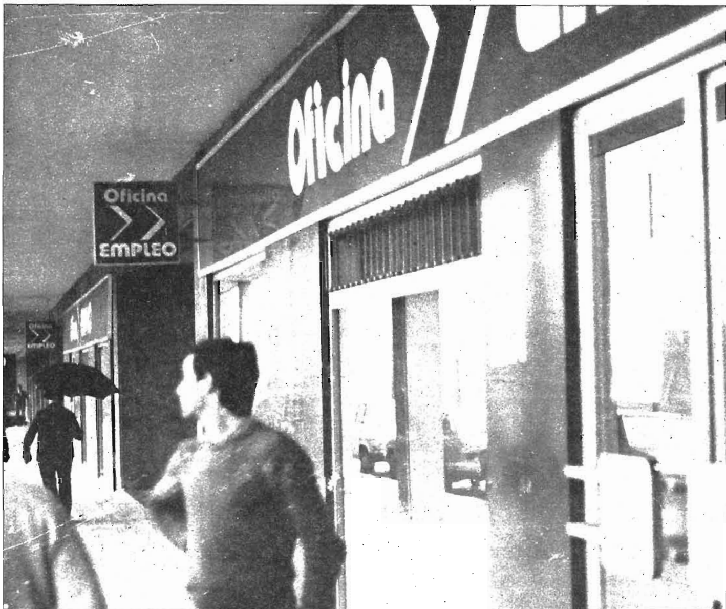
Es necesario conocer todas las situaciones posibles que dan derecho al subsidio de desempleo, así como los requisitos necesarios y los plazos