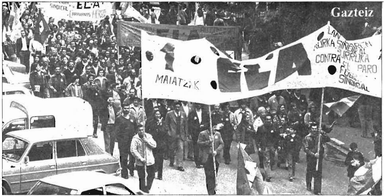
La joven y prometedora industrialización de Araba se estremece bajo la crisis. La clase trabajadora sufre en su carne los efectos derivados de la política aplicada por la clase dominante. Entre ellos el peor, el paro. De diez a quince mil trabajadores reivindicaron sus derechos el 1 de mayo. La pancarta de ELA es terca: contra el paro, fuerza sindical.

Y sin embargo, si los trabajadores hemos rajado a la calle es porque todos juntos tenemos algo que decir y mucho que reivindicar. De eso tenemos un convencimiento pleno que no siempre sabemos expresar con acierto. Vamos buscando la voz común y el grito uná-