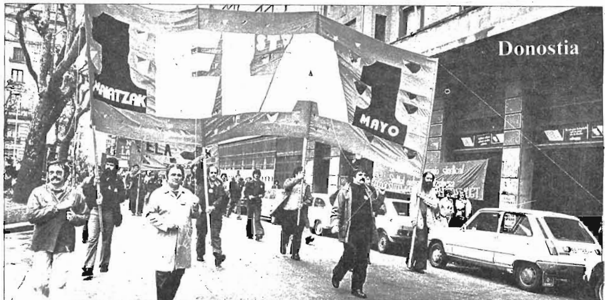
Diversas circunstancias contribuyeron para que en Donostia se reivindicara con especial fuerza la devolución del Patrimonio Sindical. Es nuestro, lo exigimos. No toleramos que lo retengan más tiempo. Las centrales sindicales, encuadrando a más de diez mil trabajadores guipuzcoanos tuvimos que dar una lección de responsabilidad y disciplina de clase.