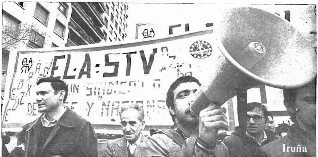
La sociedad navarra se transforma. Una clase trabajadora con voz propia emerge con fuerza. Dieciocho mil trabajadores dieron fe el 1 de mayo por las calles de Iruña de una conciencia de clase impensable hace unos años. La penetración del sindicalismo de clase y nacional, como pide la pancarta de ELA, es capital para que la clase trabajadora navarra estructure su identidad.