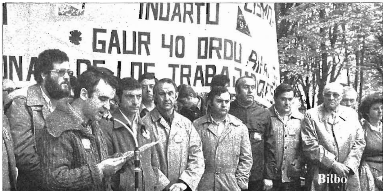
Más de cuarenta mil trabajadores vizcainos, tras las pancartas sindicales, afuyeron sobre el arenal para escuchar y respaldar el manifiesto del 1 de mayo leído por el representante de ELA. En la contaminada, atómosfera de Bilbao, nuevas generaciones de trabajadores, con el mismo vigor que a principios de siglo, hacen