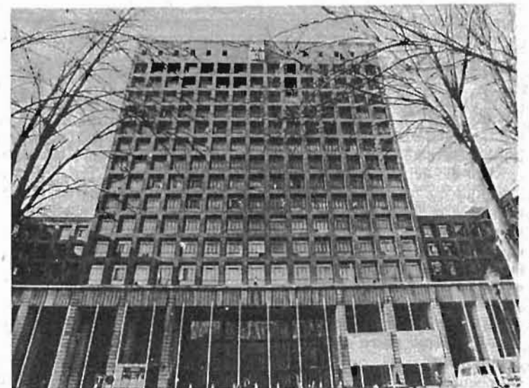
La casa del vertical ha sido la cuna de "independientes".

Frente a una Patronal Organizada, un Movimiento Obrero Organizado