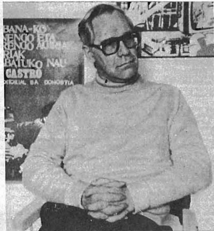
A. Gunder Frank, antiguo alumno de Chicago, hoy implacable crítico