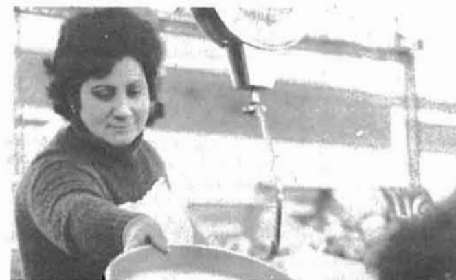
Erosketak, eguneroko abentura. Gaurko prezioak, atzoko jornalak