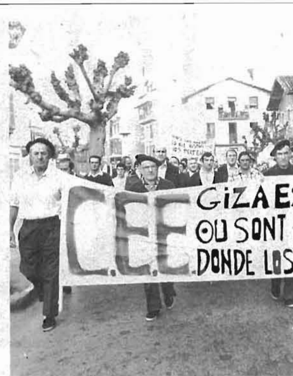
Hilaren 11ean eginiko manifestazioaren lehen pankarta

Abenduaren lehenera arte sententziarik ez