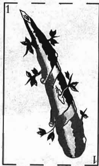
Instrumento para cazar Pa(c)tos

debajo del brazo. El Pa(c)to de Santiago organiza un gran revuelo en la Universidad de Yale.