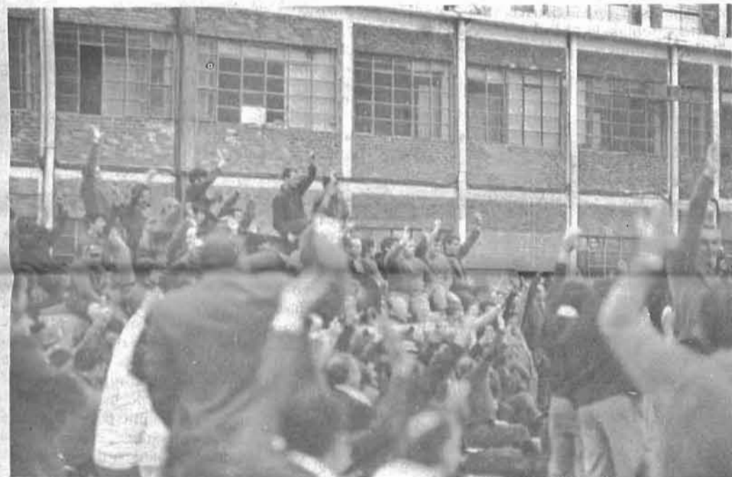
Madriren ez digute kasurik egin

Azaroaren 11ean, m tazio handi bat eratu