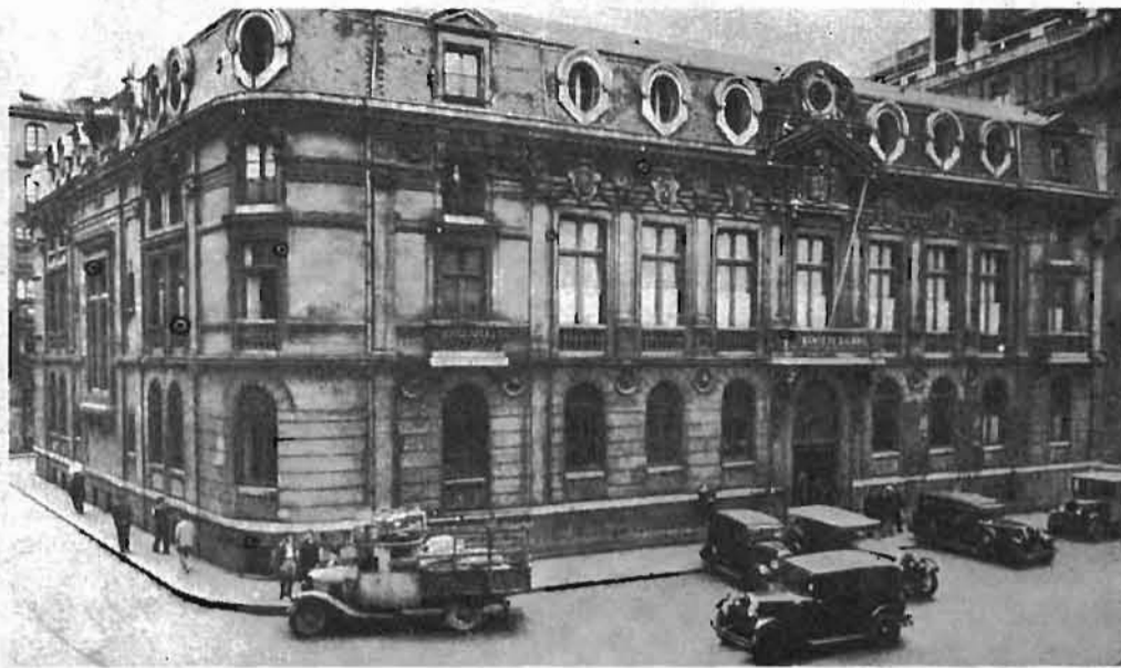
Edificio del Banco Bilbao, símbolo del capital financiero vizcaino