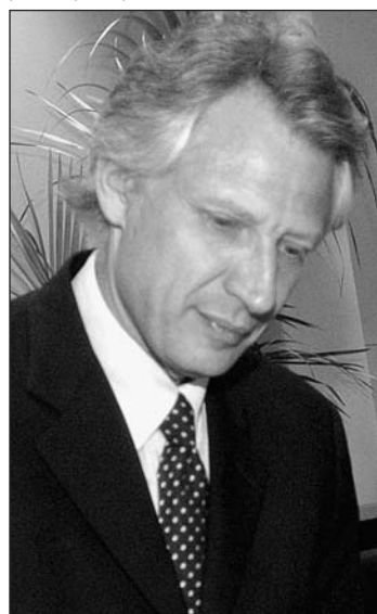
Dominique de Villepin

gouvernement français cesse de soutenir une politique qui soulève toujours autant d'interrogations à travers l'Europe. Il nous semble cependant que le gouvernement Zapatero s'est engagé depuis quelques mois sur une voie