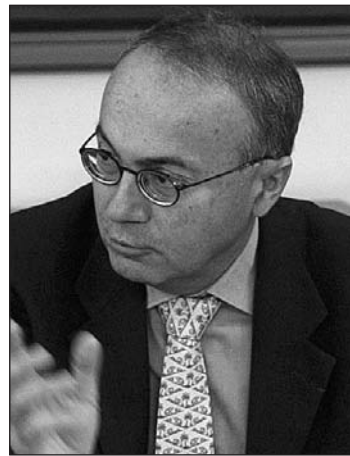
Le Préfet Marc Cabane

Sur la question des prisonniers, la gêne était beaucoup plus tangible. Lorsque la loi a été invoquée par les représentants d'AB pour justifier le rapprochement des prisonniers condamnés, les deux fonctionnaires dévièrent le débat sur les incarcérations préventives et renvoyèrent la balle à la Justice. Puis excédé devant l'insistance des membres d'AB sur le rapprochement des condamnés, le Préfet lâcha: «Vous pensez bien qu'on ne