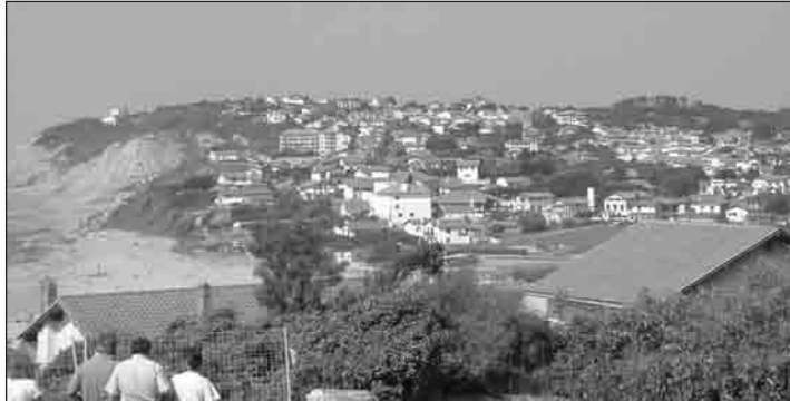
Le centre-bourg de Bidart, vu depuis le quartier de Parliamentia

moins inélégante ». Il conclue ses propos pas un jugement cinglant sur ses colistiers: « Je ne pense pas que cette équipe soit très bonne. Ils sont mal jugés par les Bidartars ». Nous sommes là bien loin du cas de figure récemment illustré par la transmission de témoin, pour des raisons de santé et en toute