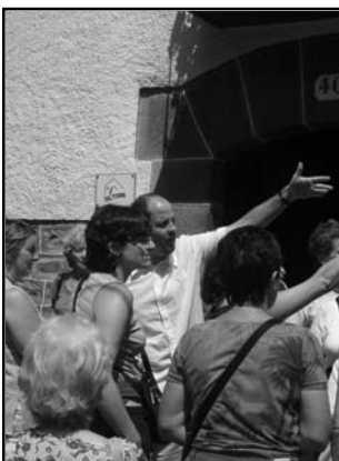
PM, guide en pleine action!