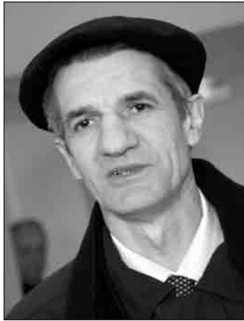
Le député Jean Lassalle lors de sa grève de la faim

débrouillent comme ils veulent, je veux les mêmes avantages, ni plus ni moins». Difficile de rivaliser face à un site industriel organisé avec pompiers, médecins, gardiennage, maintenance, sous-traitants, laboratoire et surtout le